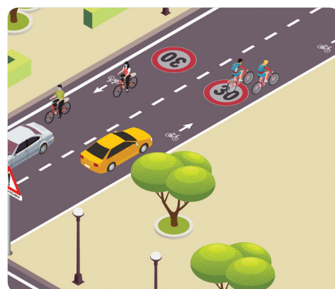
Strada urbana ciclabile, E-bis Scheda 6

Questa pubblicazione, redatta a uso delle associazioni FIAB, delle Amministrazioni pubbliche e di tutti gli utenti della strada, è organizzata in schede, allo scopo di facilitare l'applicazione dei cambiamenti al Codice della Strada. I provvedimenti favoriscono la mobilità ciclistica in un periodo dove la pandemia rende difficile l'utilizzo dei mezzi pubblici, con il rischio di un aumento del traffico automobilistico privato. I provvedimenti, in quanto parte del Codice della Strada, sono attivabili subito. ("Decreto Rilancio" 120, D.L. n. 34/2020 e il "Decreto Semplificazioni" 118, D.L. 76/2020).