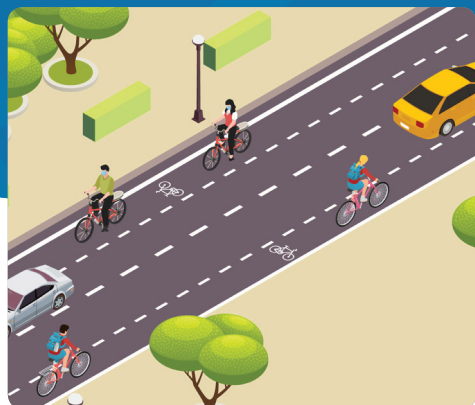
Corsia ciclabile Scheda 1

I nuovi provvedimenti del Codice della Strada per favorire la sicurezza ciclabile