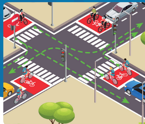
Casa avanzata Scheda 3