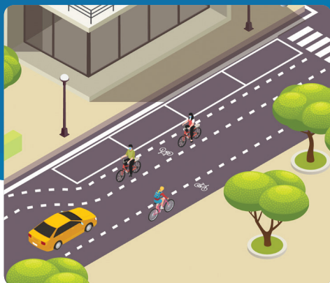
Corsia ciclabile per doppio senso ciclabile Scheda 2