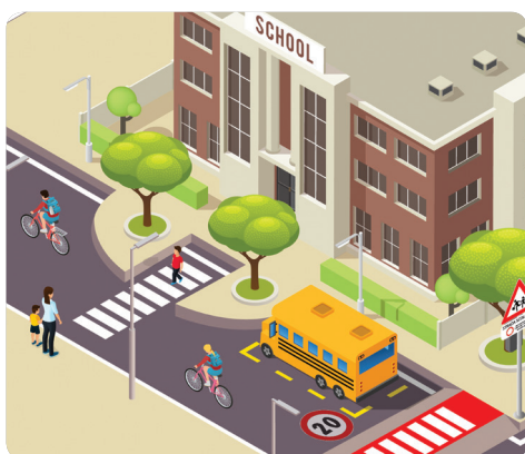
Zona scolastica Scheda 5