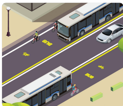
Uso ciclabile di corsie preferenziali Scheda 4