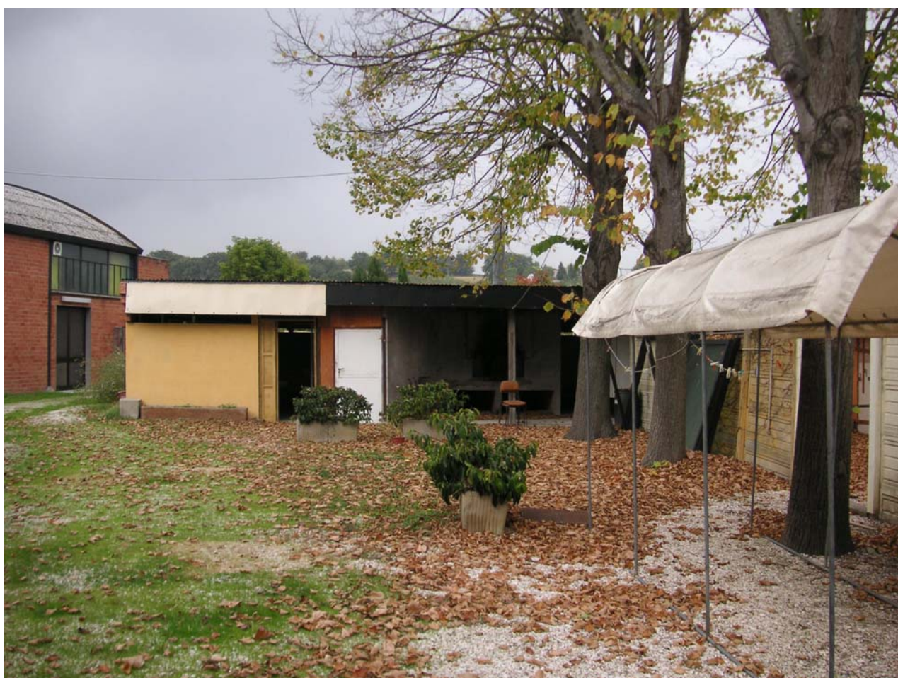
18 - forno e tettoie