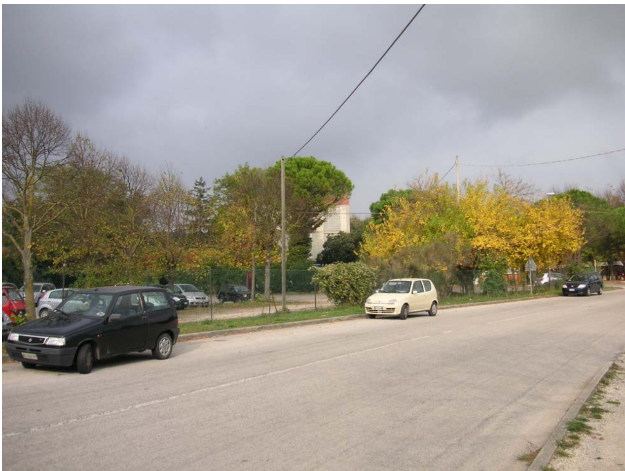
2 - vista da carignano