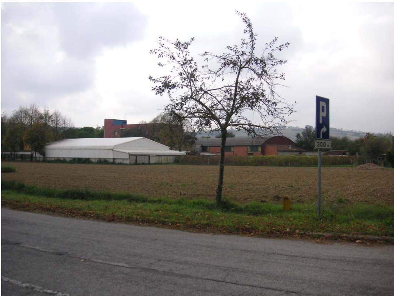
1 - vista da Via Bevano