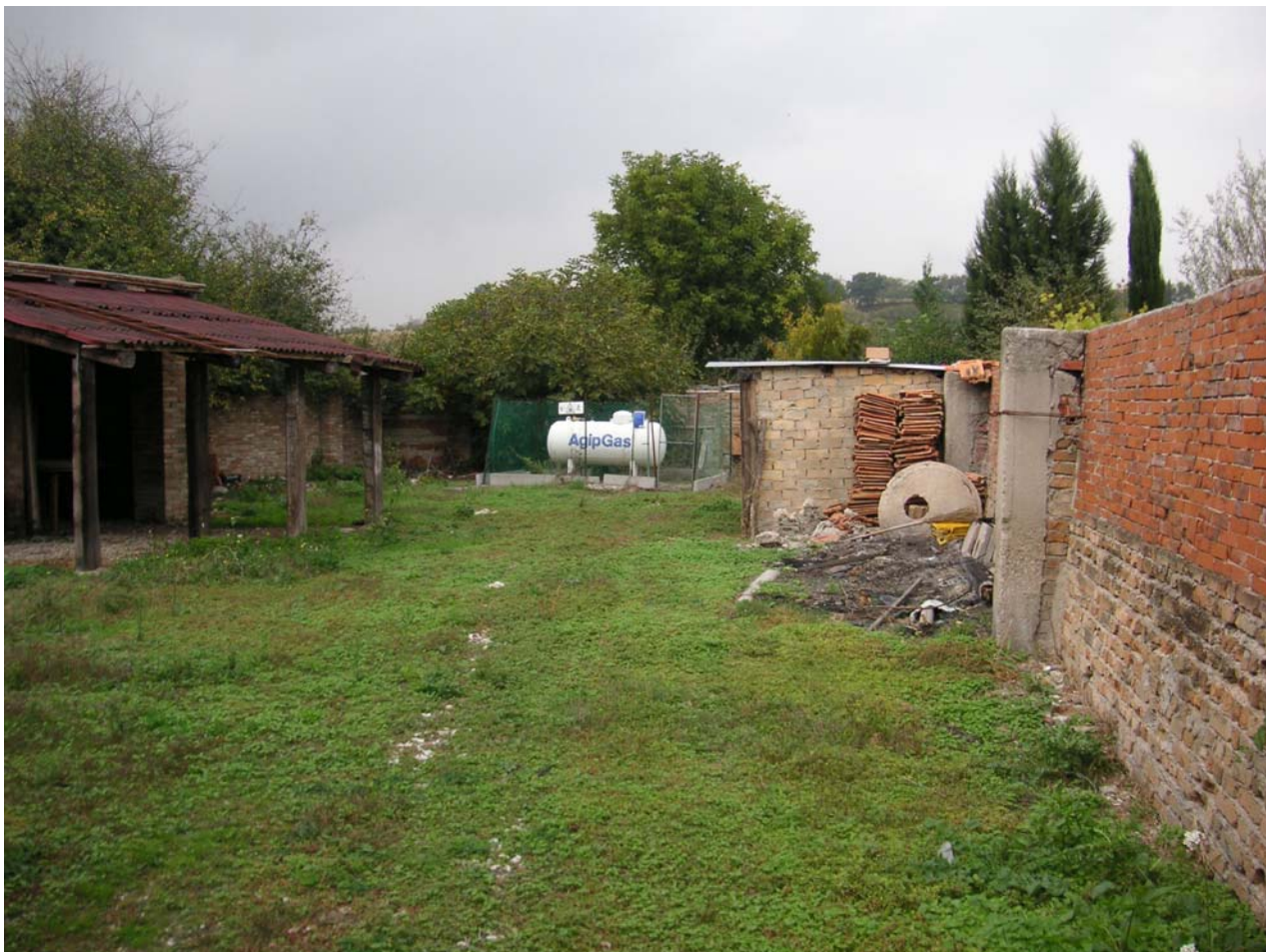
11 - accessori retro