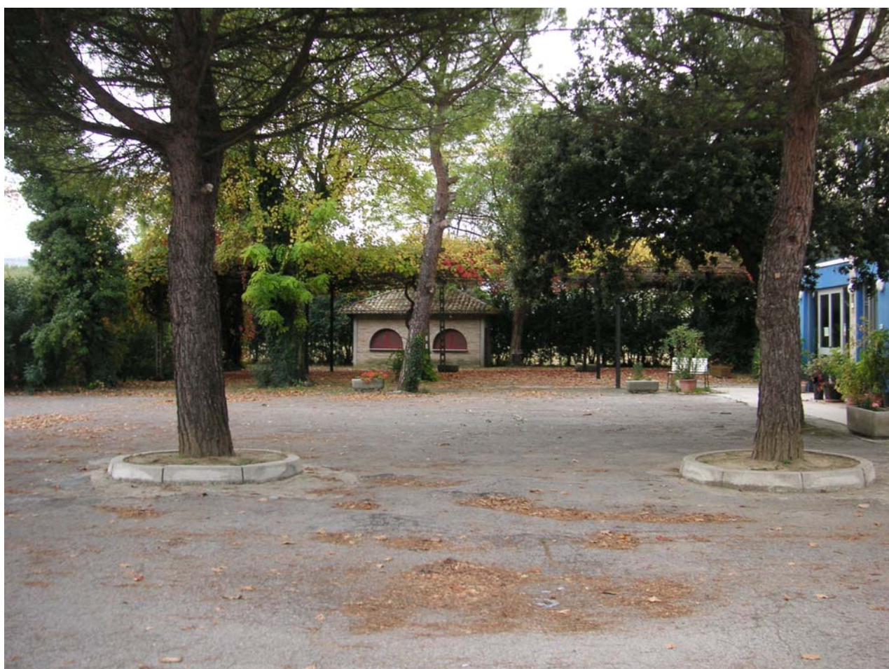
20 - piazzale 4