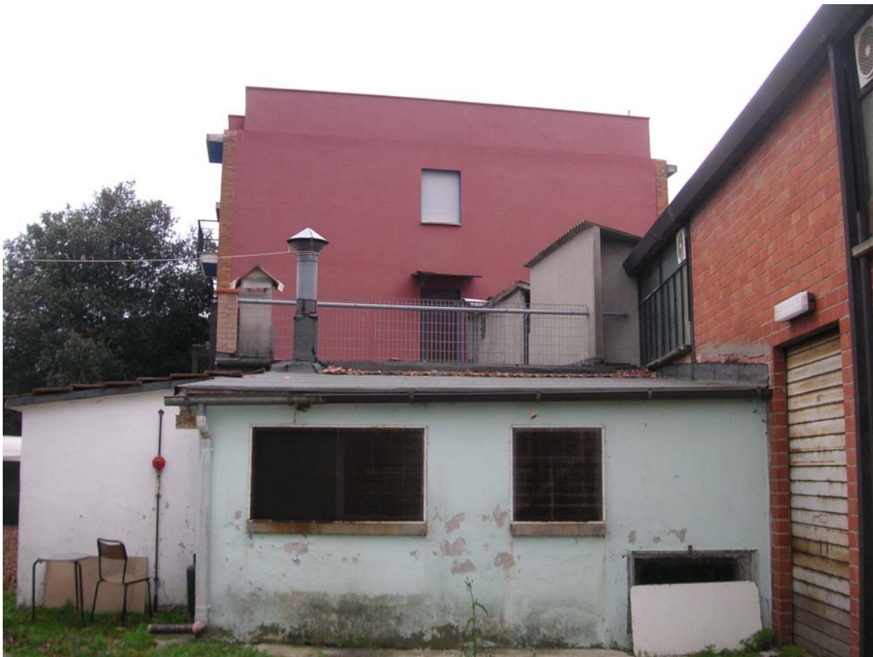
9 - retro2