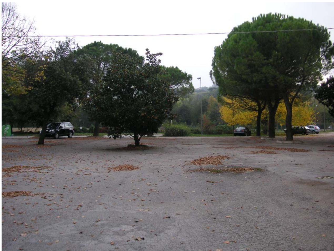
19 - piazzale2