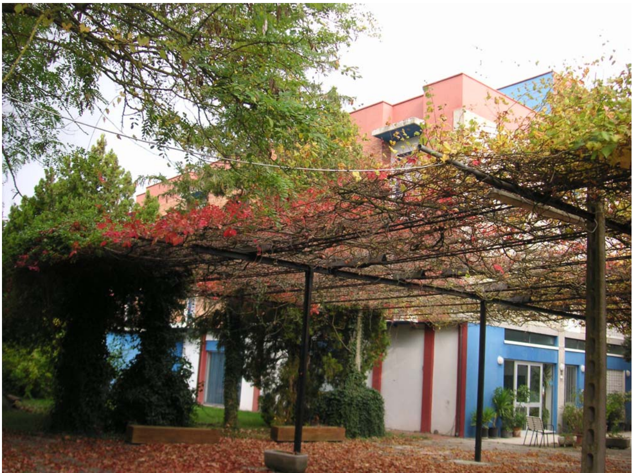
14 - fianco campagna