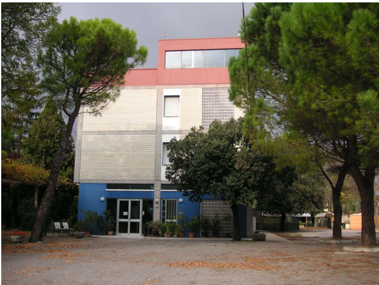
6 - ingresso