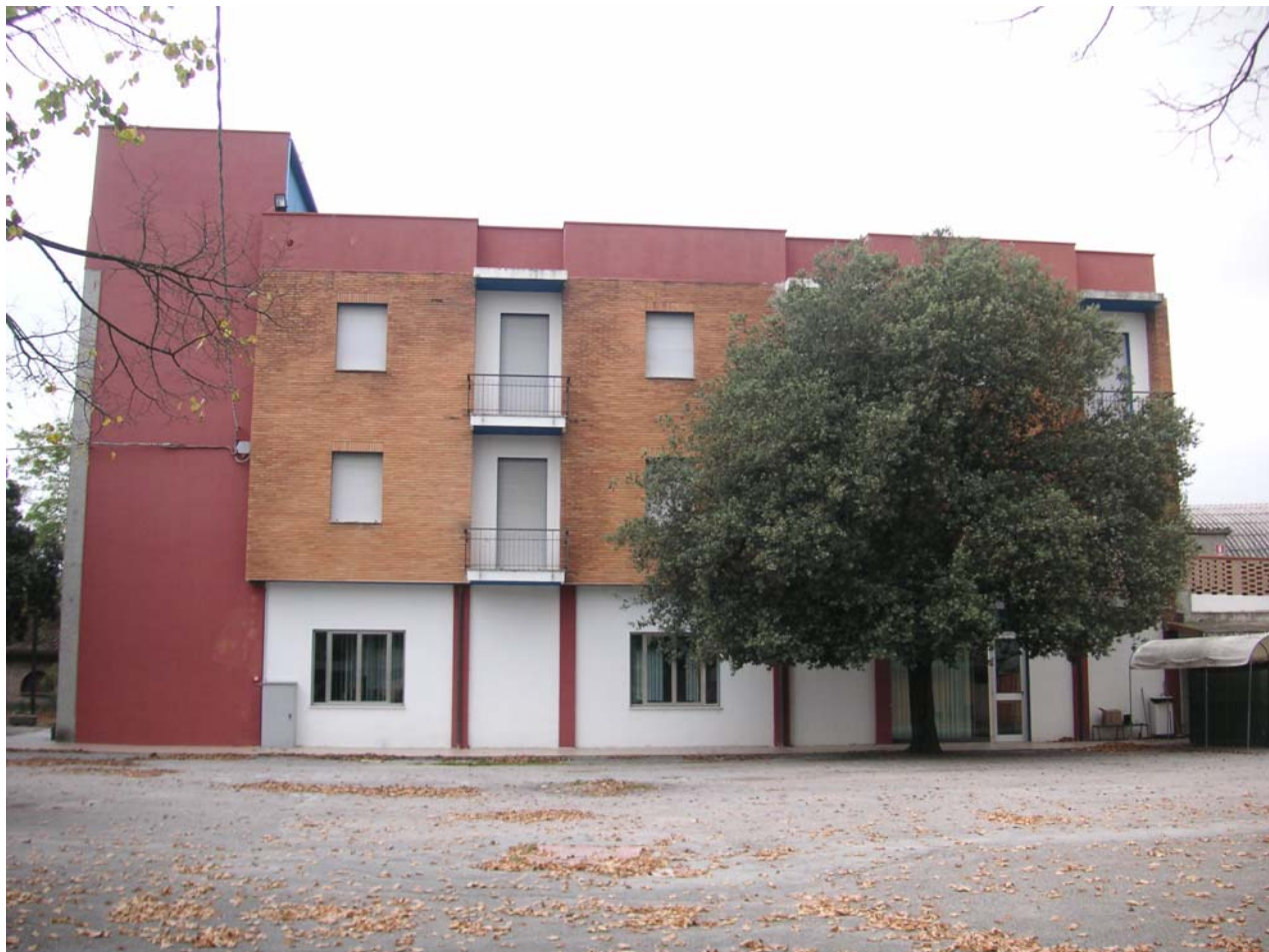
7 - lato strada