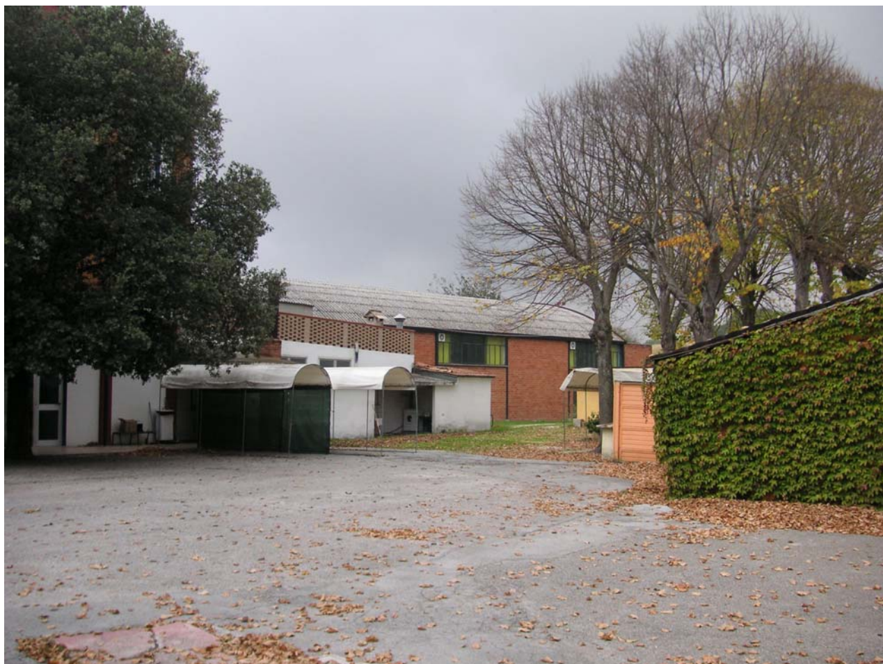
8 - capannone