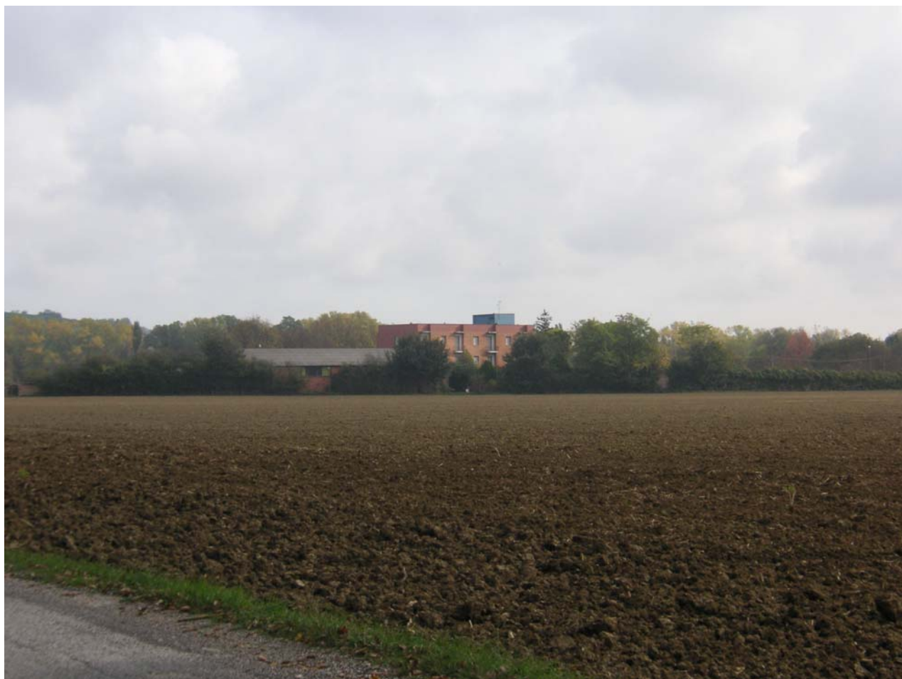
3 - vista lato campagna2