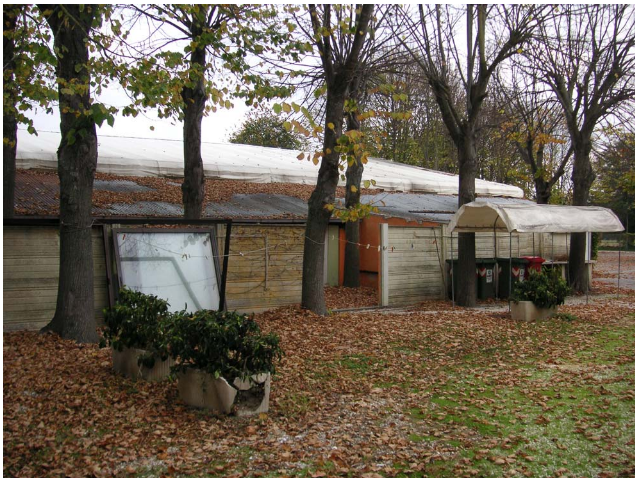
17 - dancing lato