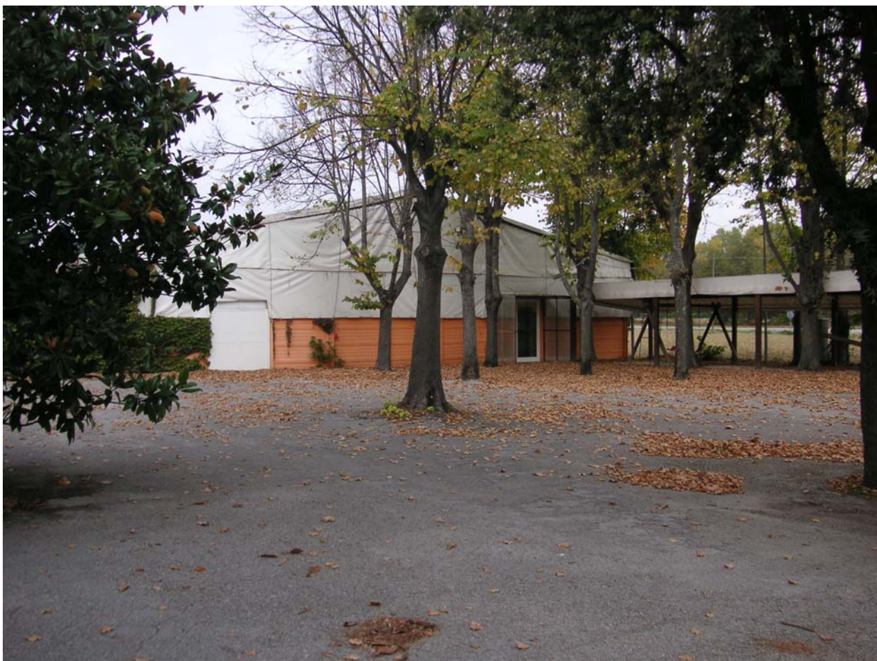
16 - dancing 2