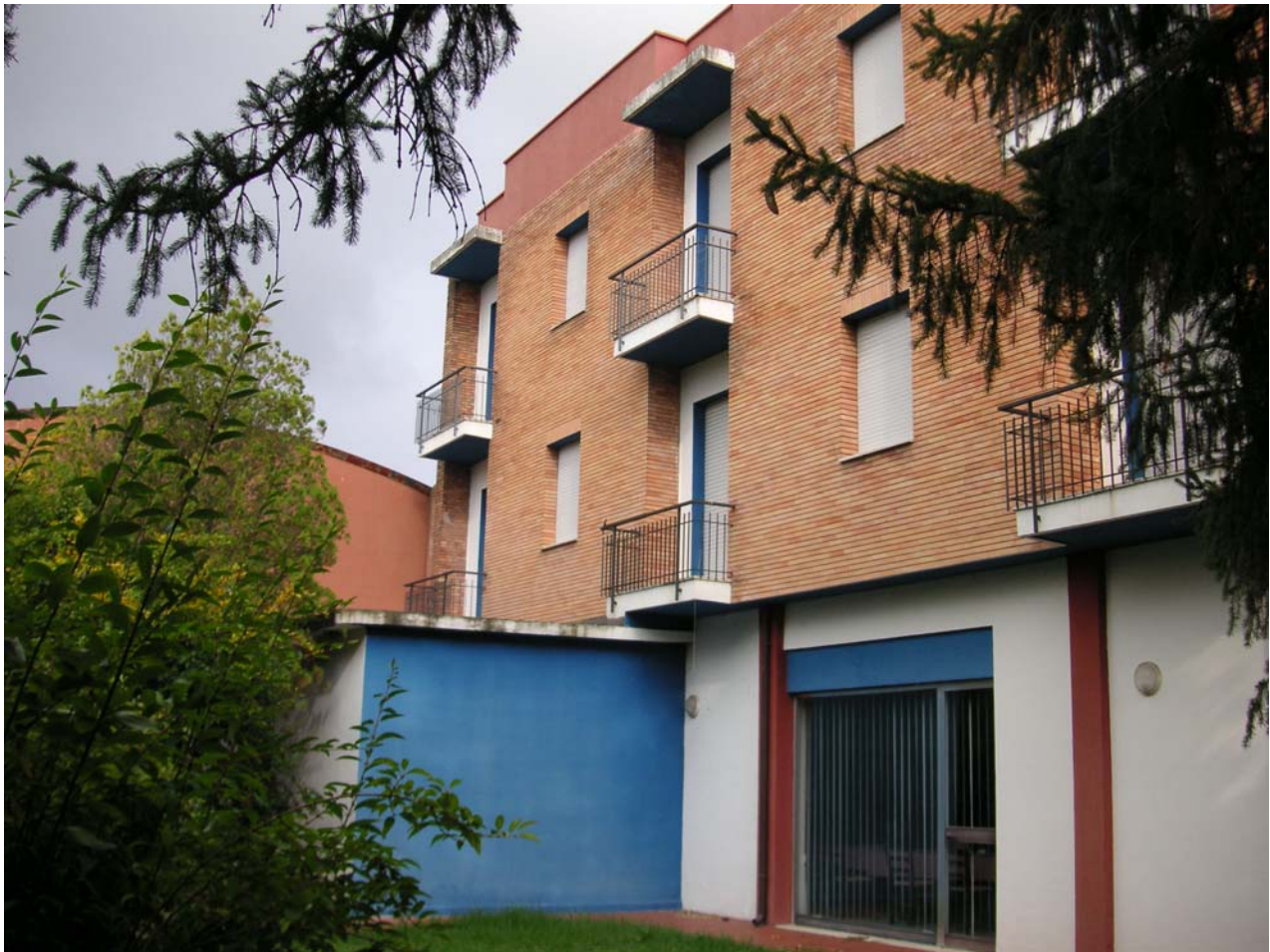
13 - fianco campagna2