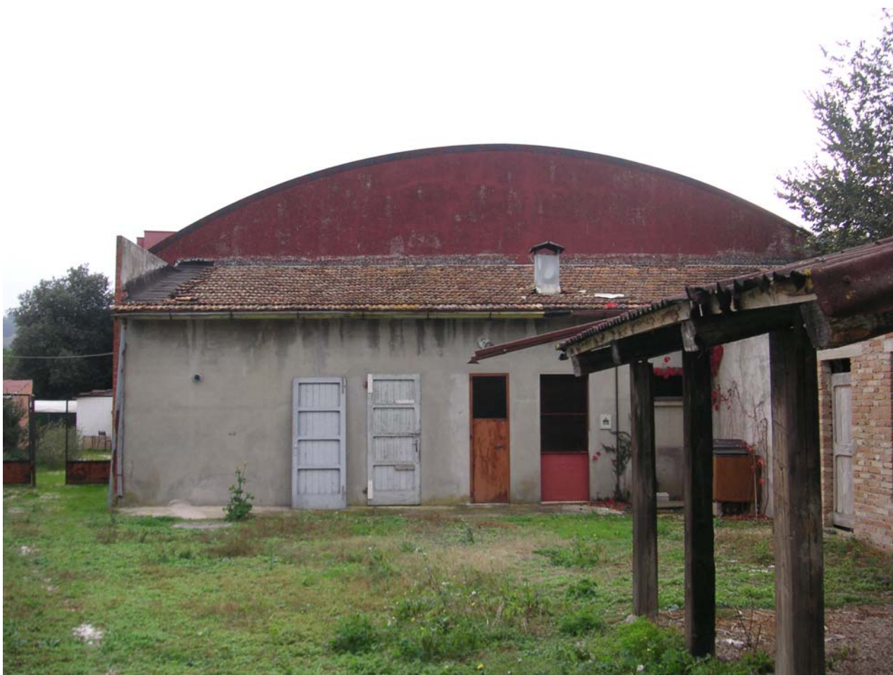
10 - retro capannone