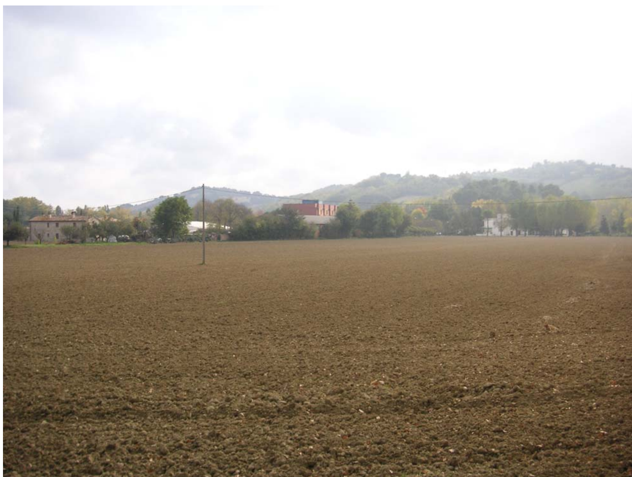
4 - vista del fianco lato campagna