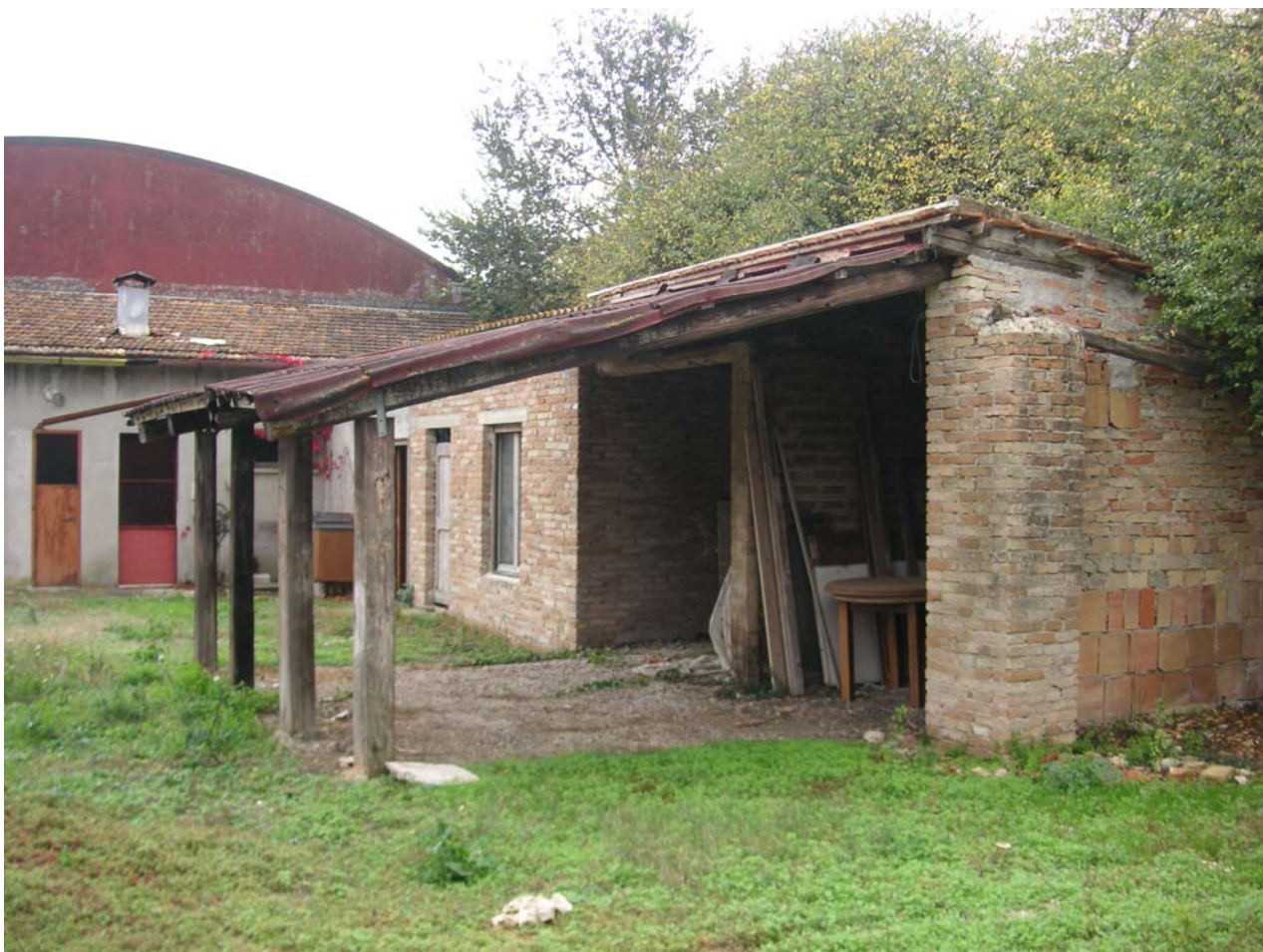
12 - tettoie retro