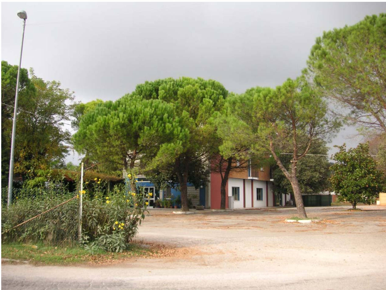
5 - ingresso carrabile