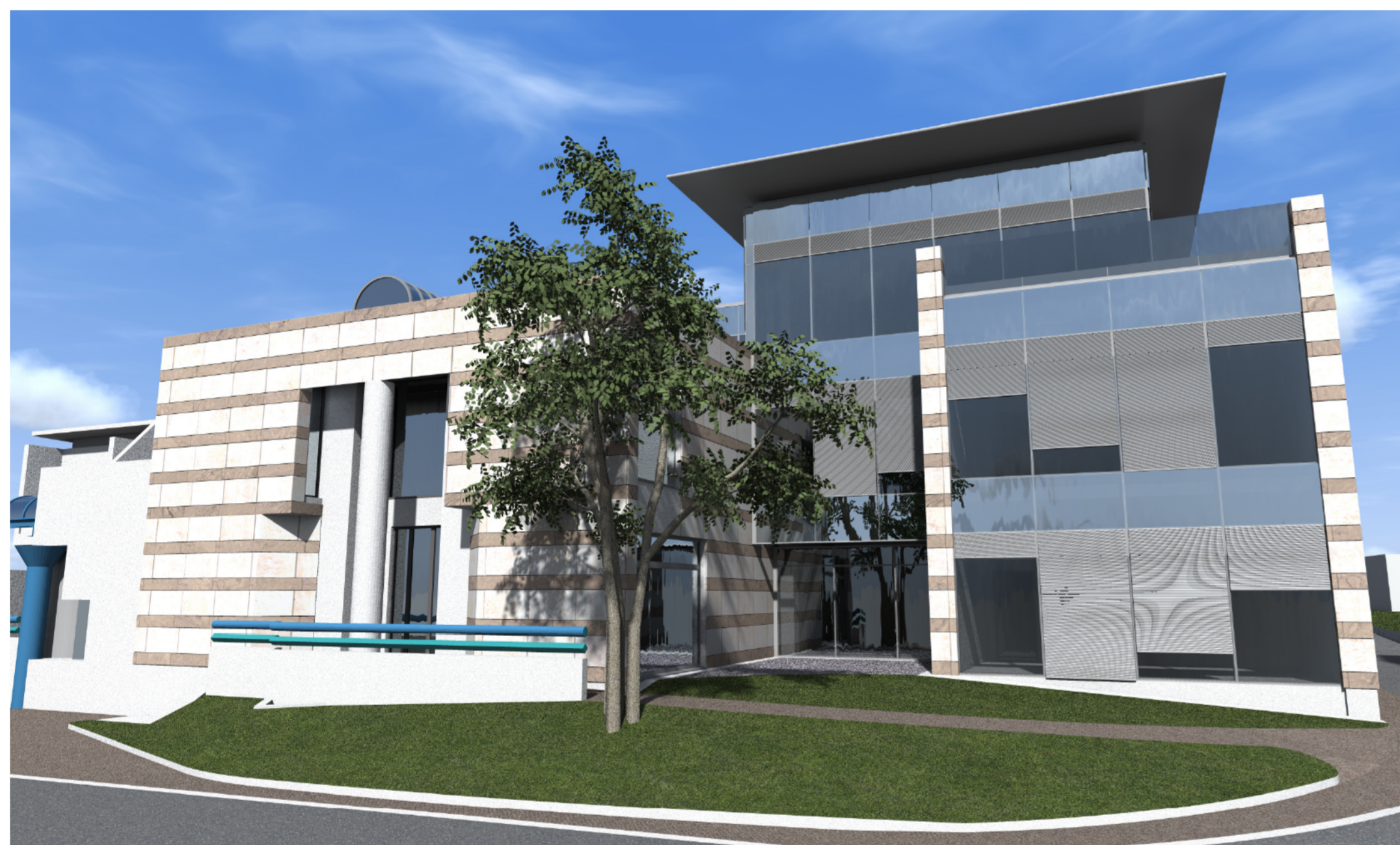
VISTA INDICATIVA 3D

VERIFICARE COMUNQUE RISPONDEZA CON QUANTO PREVISTO DAL TECNICO DEGLI ISOLAMENTI TERMO-ACUSTICI ALL'INTERNO DELLA RELAZIONE L.10 E s.m.i.