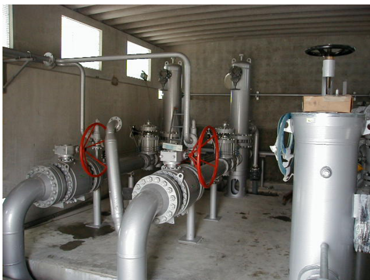
Fig. 9.1.: interno della cabina di decompressione

Il gas distribuito dall'ASET S.p.A. possiede le medesime caratteristiche fisico-chimiche di quello distribuito dalla SNAM e da EDISON, che ne certificano mensilmente il potere calorifico superiore (che chiameremo P.C.S. 69 ) Il P.C.S. di riferimento del naturale è: 9200 \text{ Kcal/Sm}^3 .