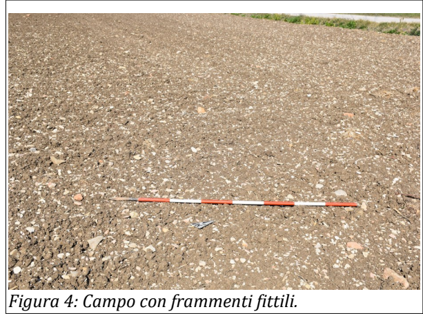
Figura 4: Campo con frammenti fittili.

La situazione è apparsa completamente diversa lungo il lato nord-est della Strada Statale 16, in cui la maggior parte dei terreni non urbanizzati, è risultata non accessibile in quanto chiusa da recinzioni.