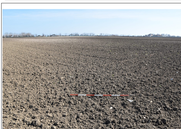
Figura 3: Visibilità ottima.

Qualche appezzamento, arato da poco, era addirittura arato da poco e dunque in condizioni ottimali di visibilità ( Figura 3, 4 e 5 ). All'interno di un campo in prossimità della Strada Comunale Sant'Egidio è stato possibile rilevare la presenza di alcuni frammenti di mattoni, caratterizzato da impasto arancio, di probabile epoca moderna, frammisti a ghiaia ( Figura 6 ).