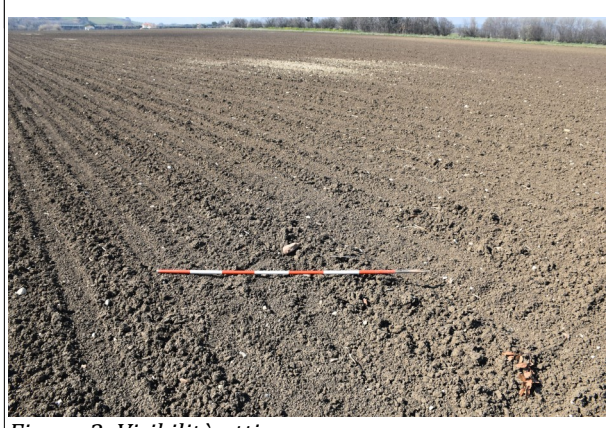
Figura 3: Visibilità ottima.