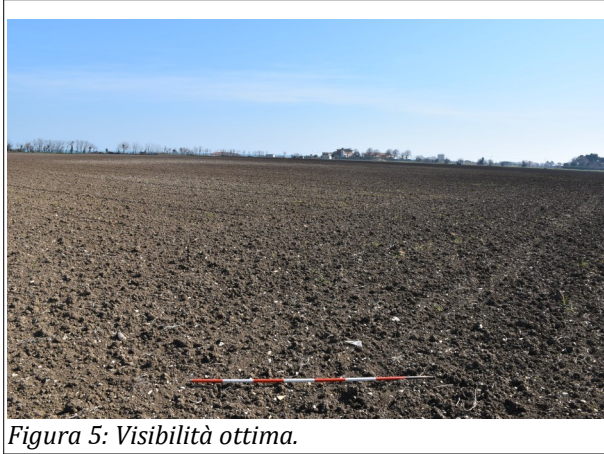
Figura 5: Visibilità ottima.

Considerando l'esiguità della dispersione e la probabile natura erratica dei frammenti, si è deciso di segnalare soltanto l'anomalia senza assegnare una vera e propria Unità Topografica.