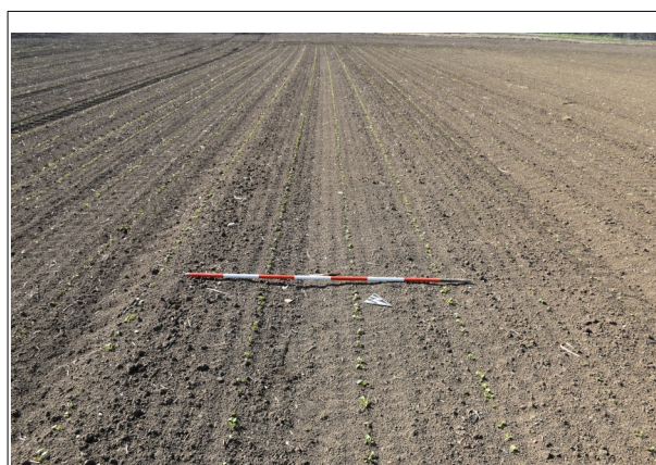
Figura 1: Visibilità buona.