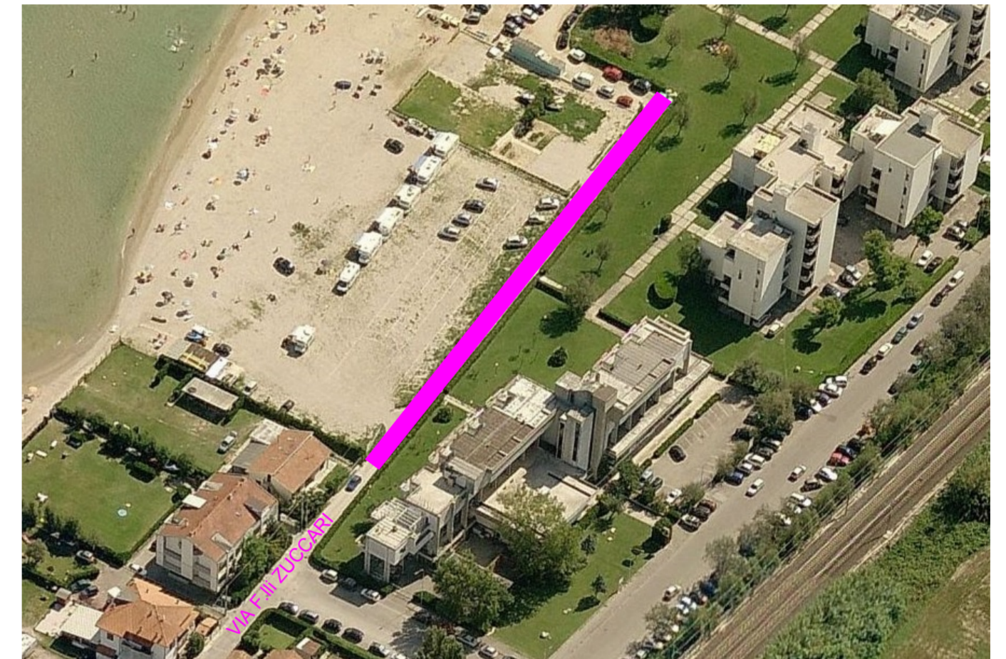
VISTA FOTOGRAFICA AEREA