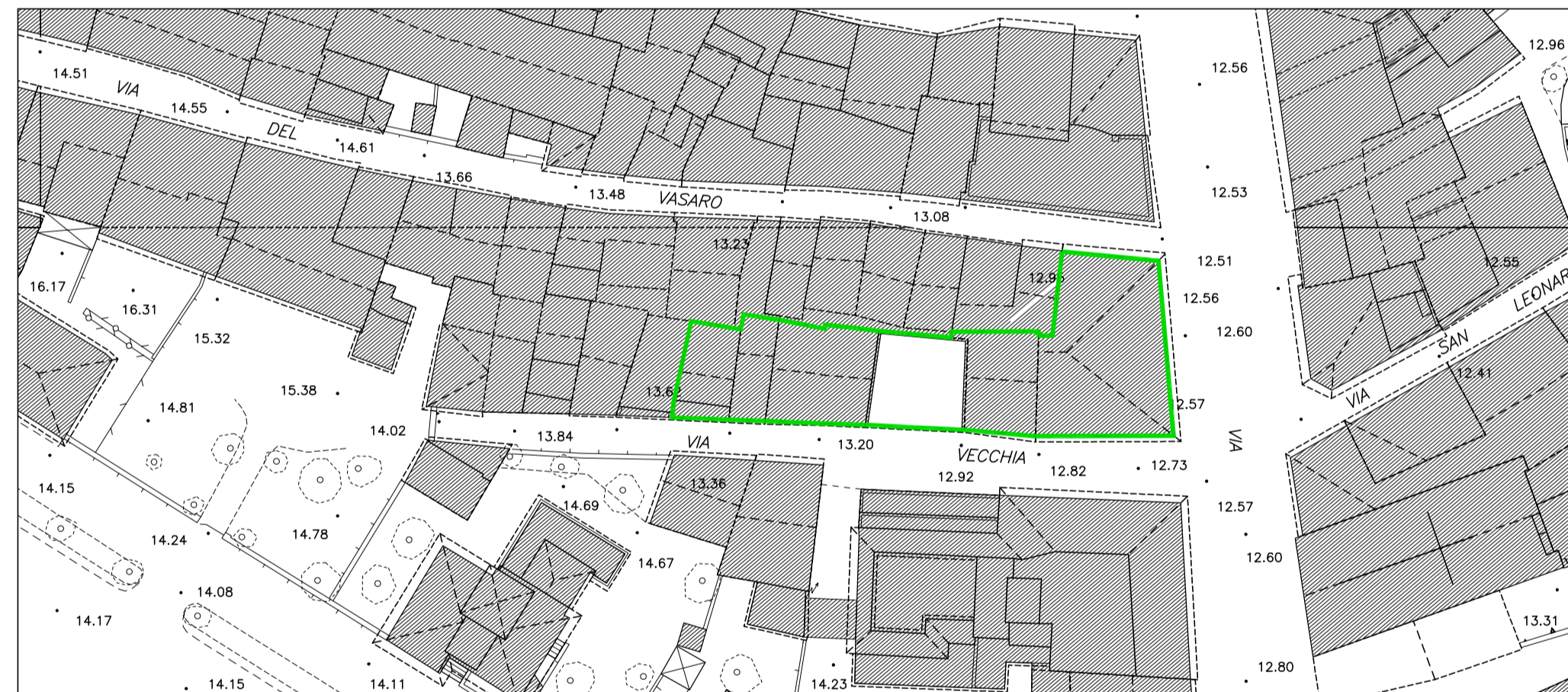
Estr. AEROFOTOGRAMMETRICO scala 1:500