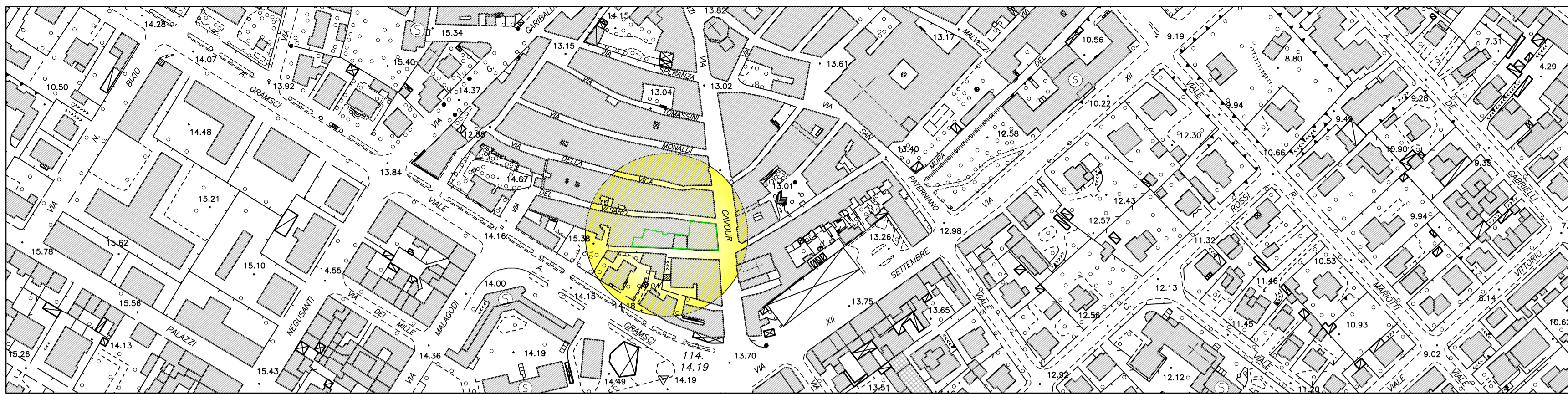
LOCALIZZAZIONE DELL'INTERVENTO ALL'INTERNO DEL CENTRO STORICO