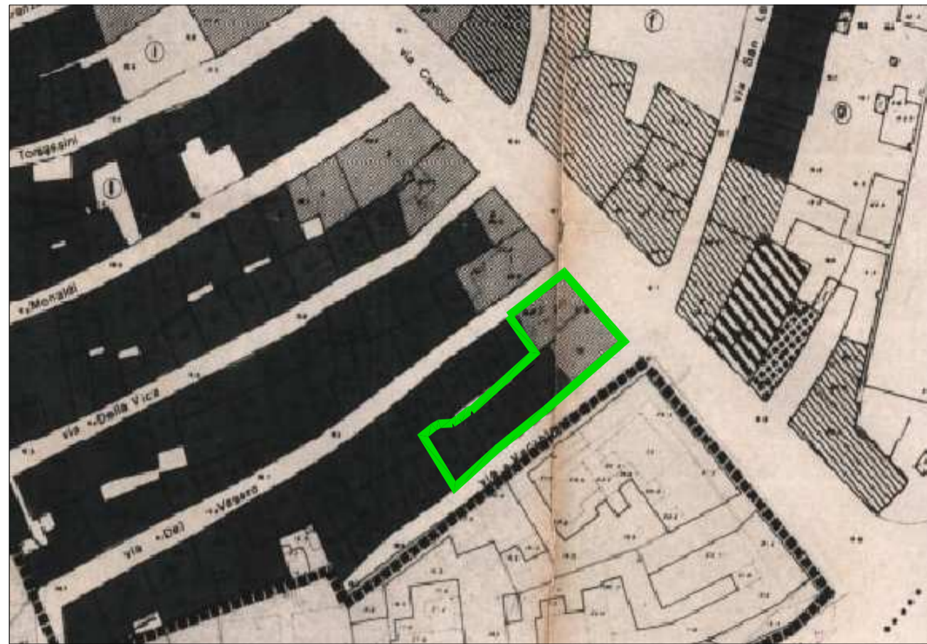
ESTR. P. P. DEL CENTRO STORICO Scala 1:1000 Destinazione d'uso : Residenziale - Mista 3