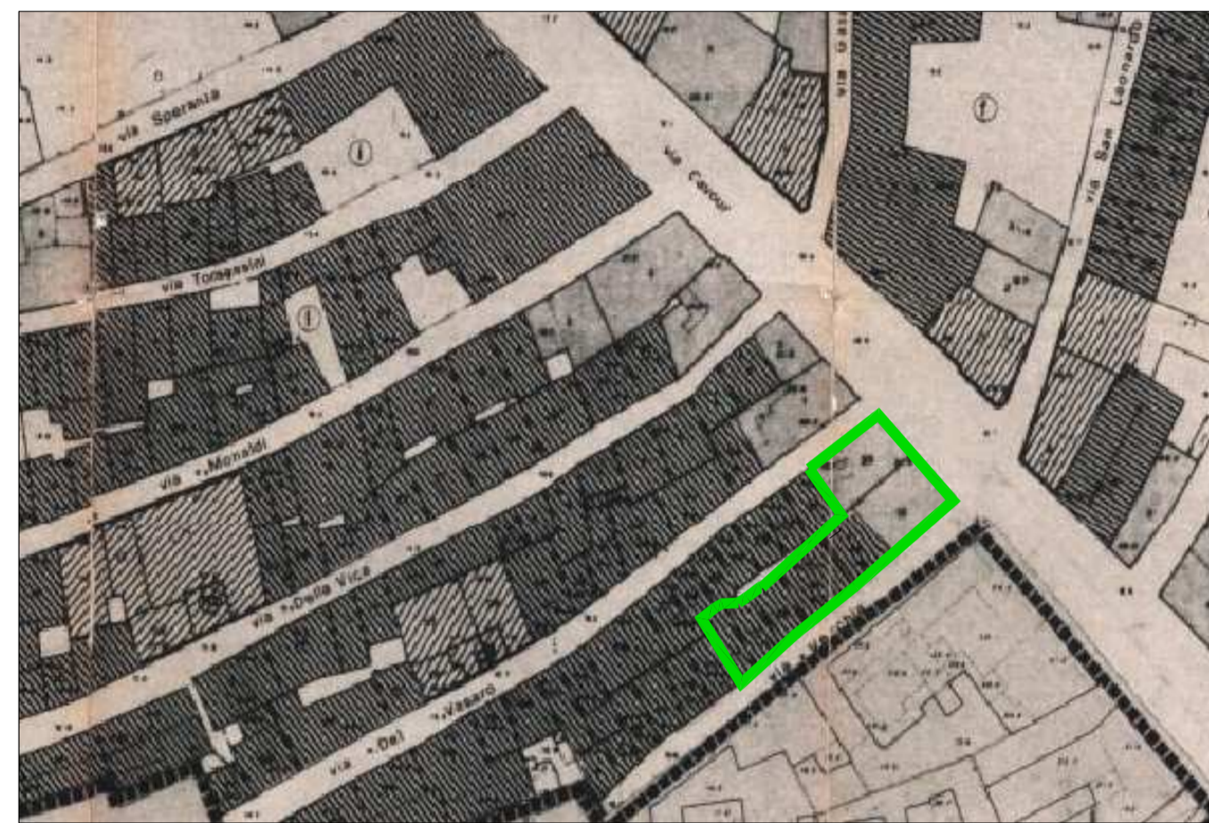
ESTR. P. P. DEL CENTRO STORICO Scala 1:1000 Vincoli agli interventi : A2 - A3