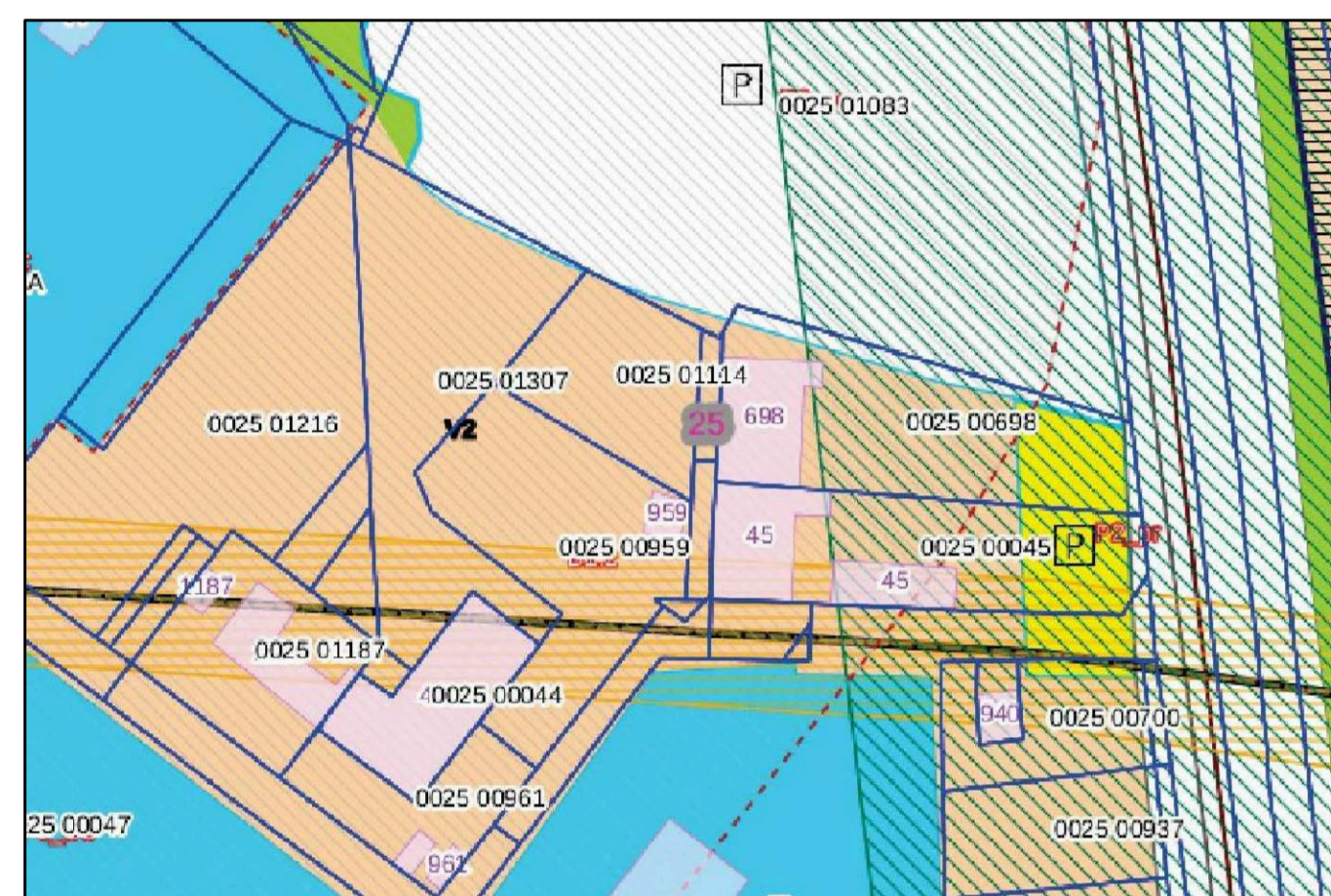
Stralcio PRG 1:1000 B1.2 - Zone Residenziali sature con conservazione della superficie coperta dei fabbricati