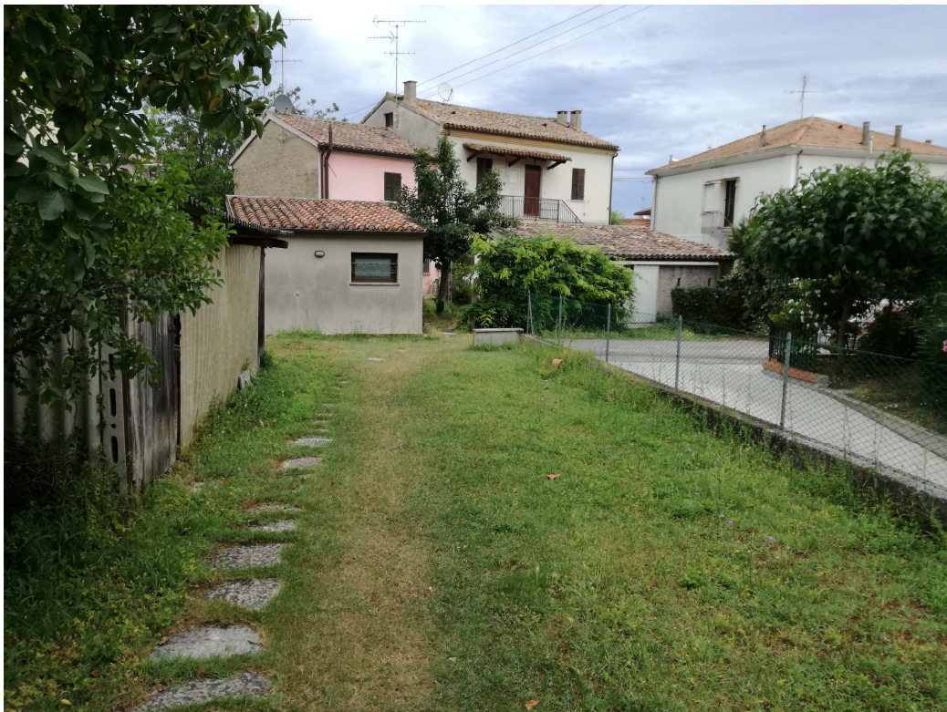
PUNTO DI VISTA FOTOGRAFICO 10