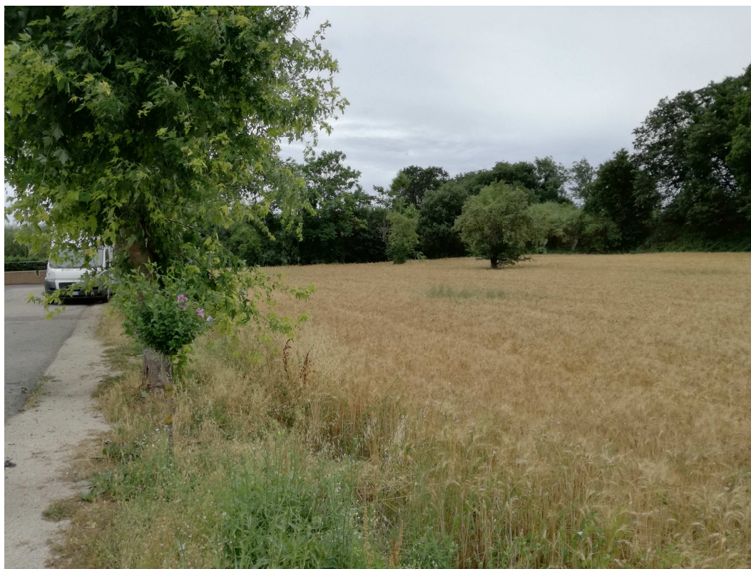
PUNTO DI VISTA FOTOGRAFICO 2