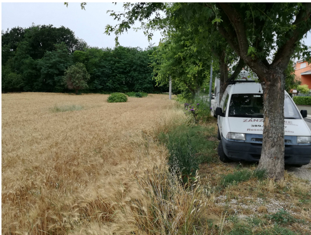
PUNTO DI VISTA FOTOGRAFICO 1