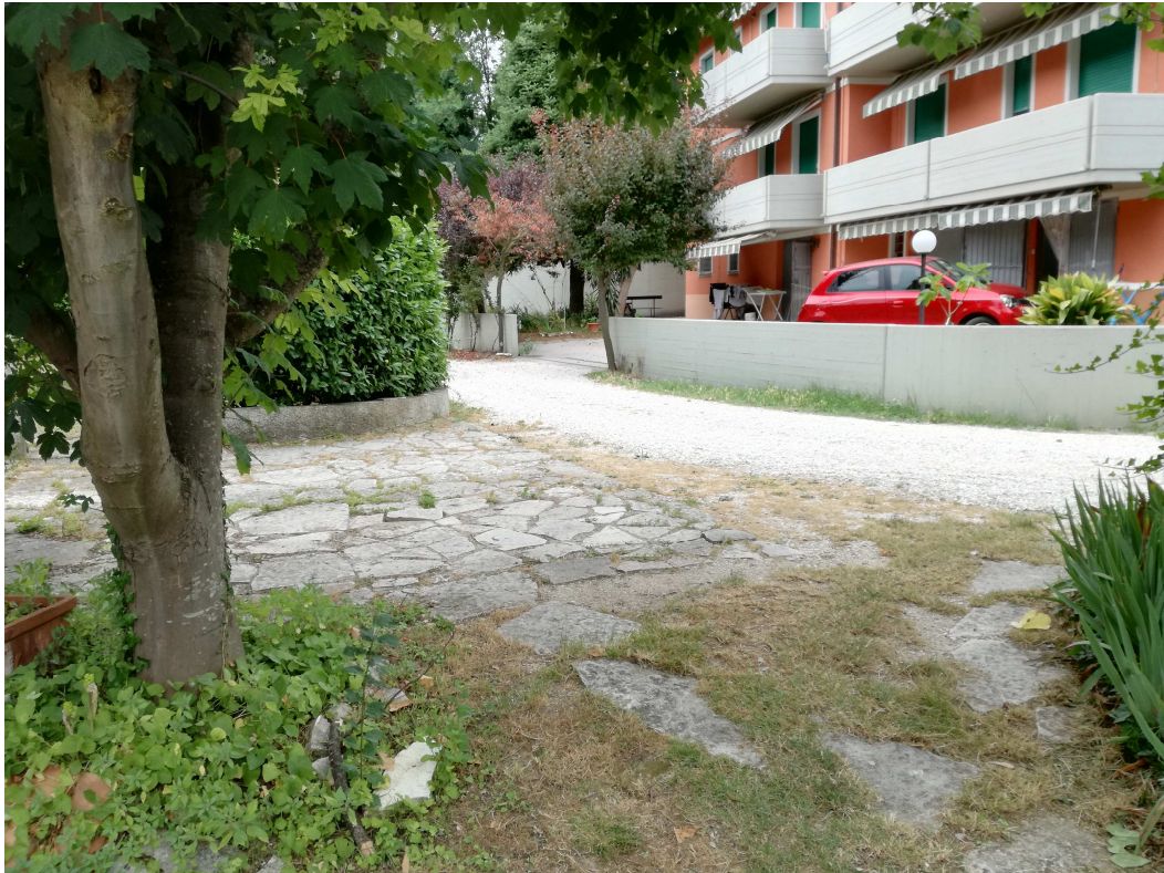
PUNTO DI VISTA FOTOGRAFICO 9