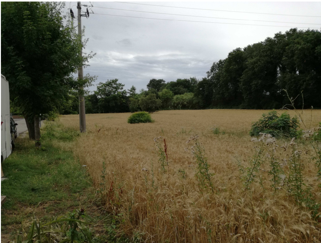
PUNTO DI VISTA FOTOGRAFICO 4