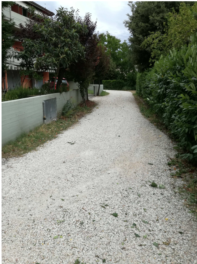
PUNTO DI VISTA FOTOGRAFICO 6