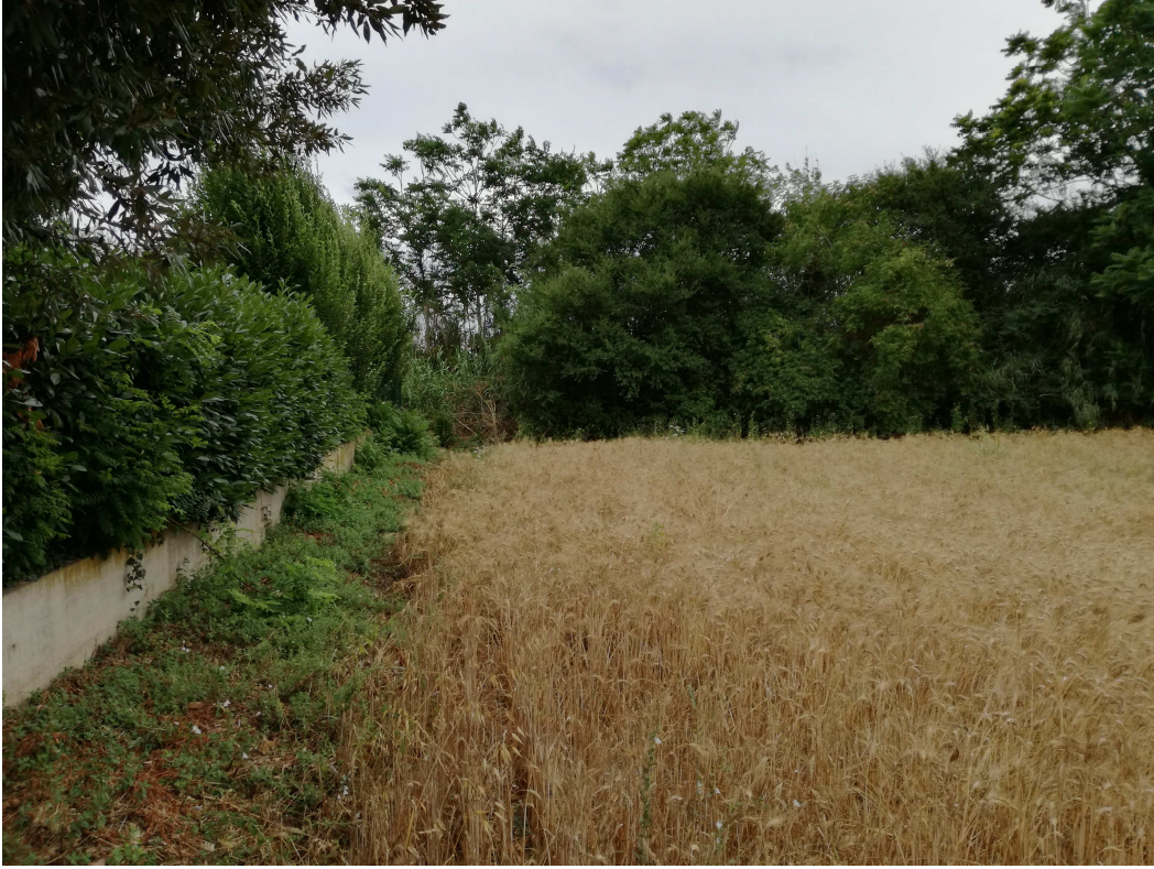
PUNTO DI VISTA FOTOGRAFICO 3