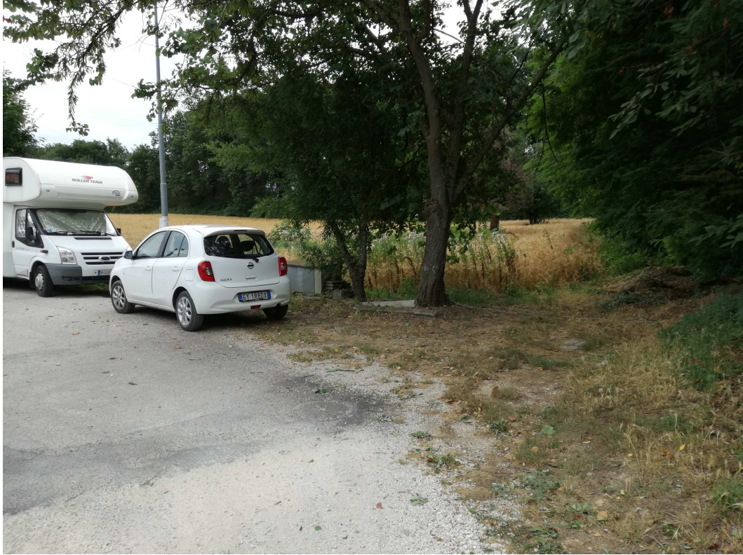
PUNTO DI VISTA FOTOGRAFICO 5