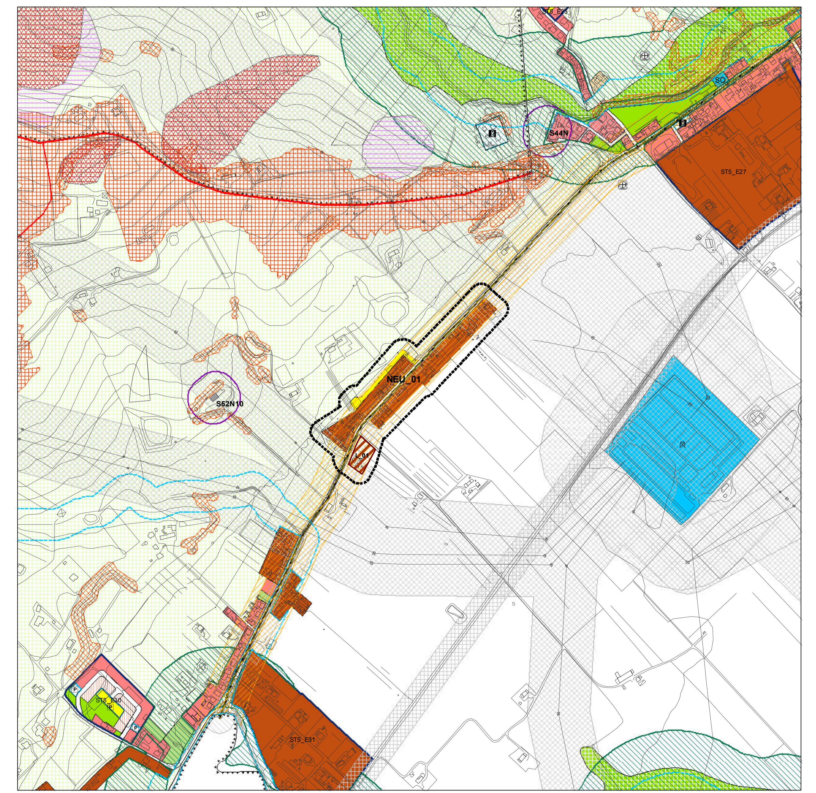
Nucleo Extraurbano e individuazione dei Lotti su base P.R.G.vigente

Nucleo residenziale extraurbano edifici esistenti manufatti esistenti Autostrada Statale Provinciale Comunale Vicinale non classificata