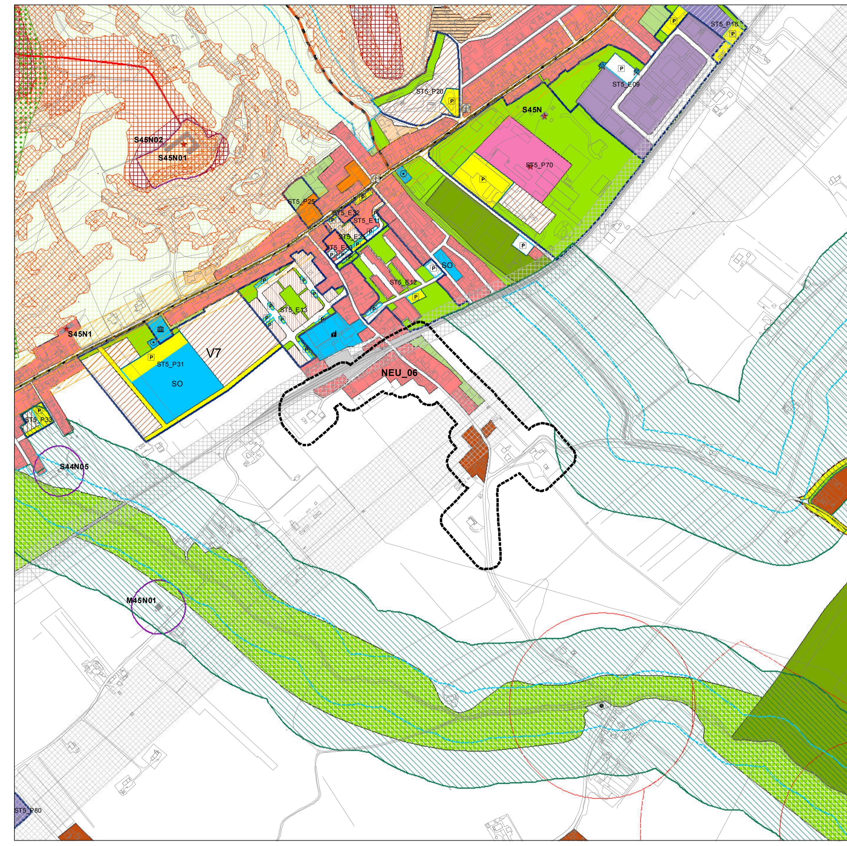
Piano Regolatore Vigente e Sistema Paesistico Ambientale