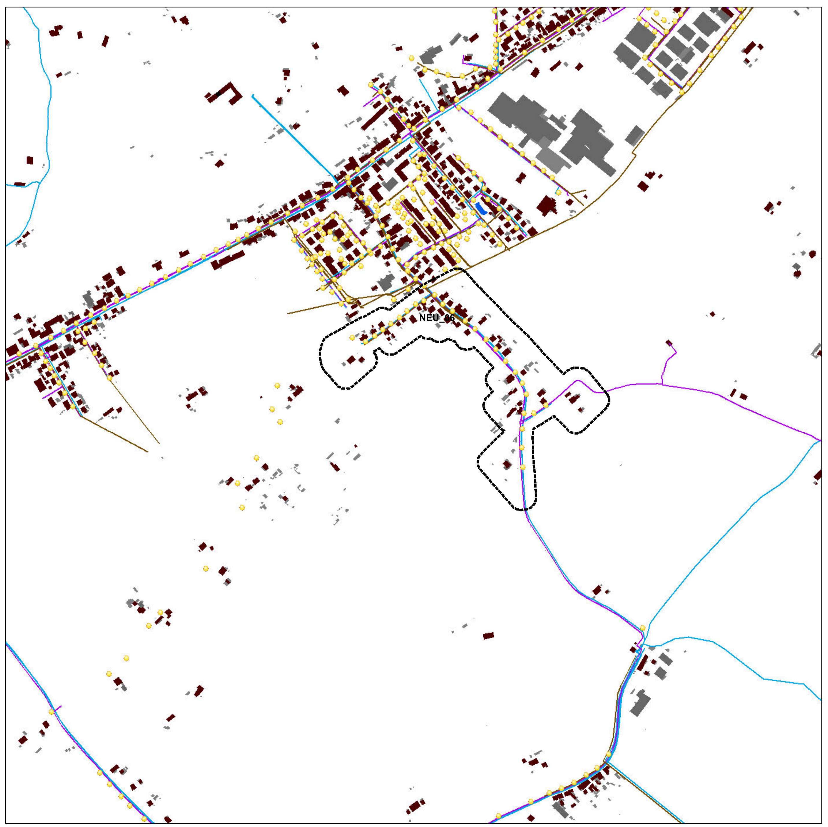
Sistema insediativo-infrastrutturale - RETI TECNOLOGICHE

Nucleo residenziale extraurbano edifici esistenti manufatti esistenti Autostrada Statale Provinciale Comunale Vicinale non classificata