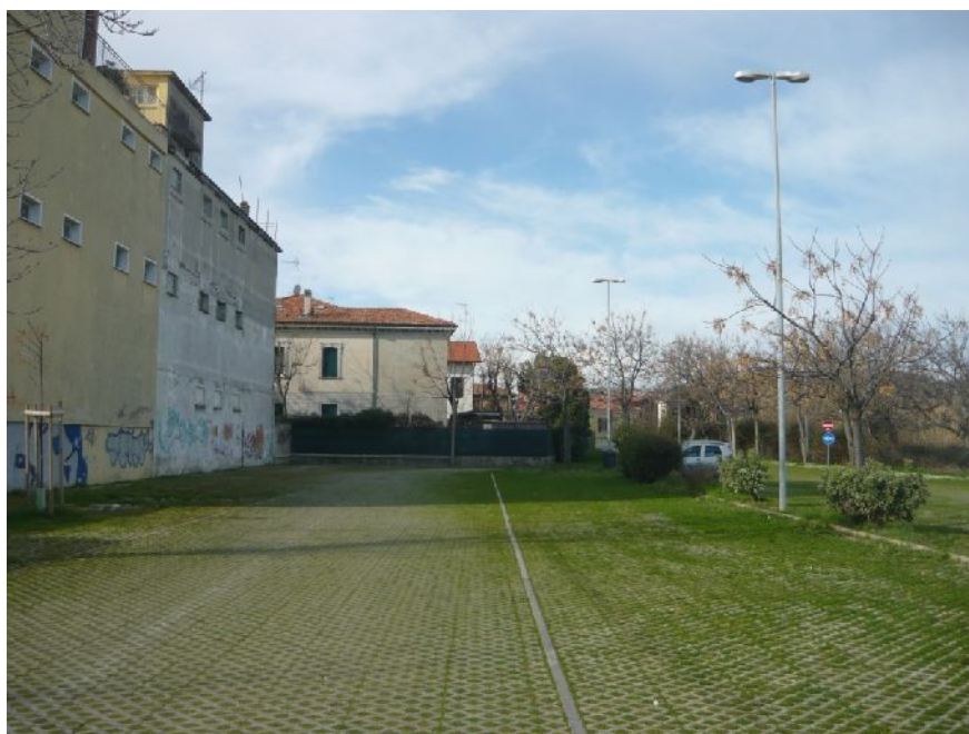
Figura 1 - Parcheggio ex-CIF