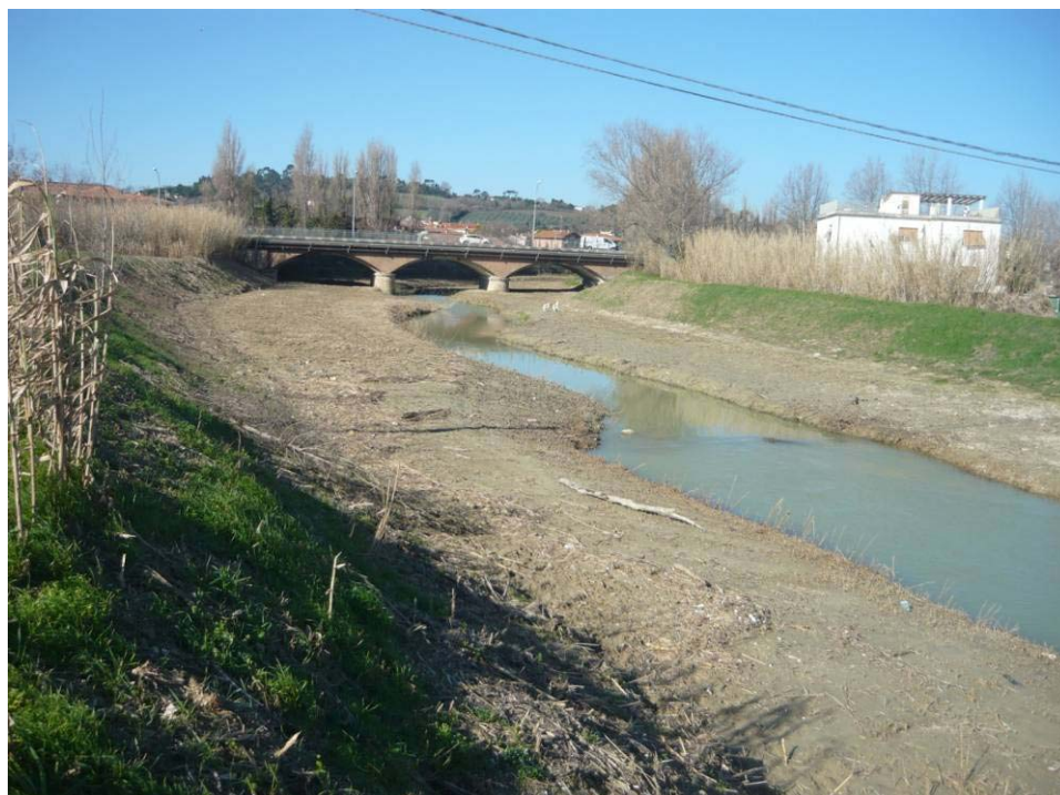
Figura 4 – Argine destro