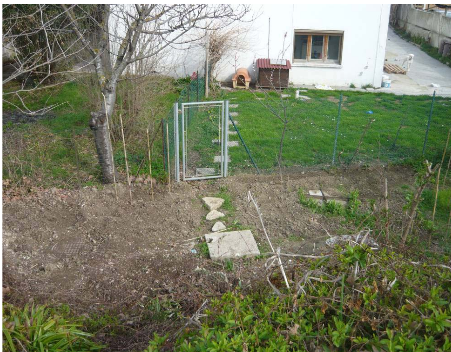
Figura 20 – Area P9