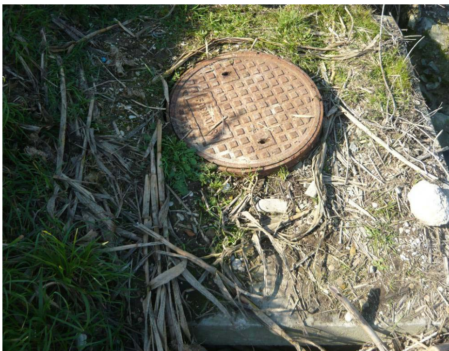
Figura 11 – Pozzetto P24