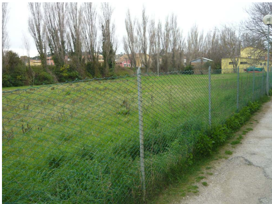
Figura 26 – Area vasca