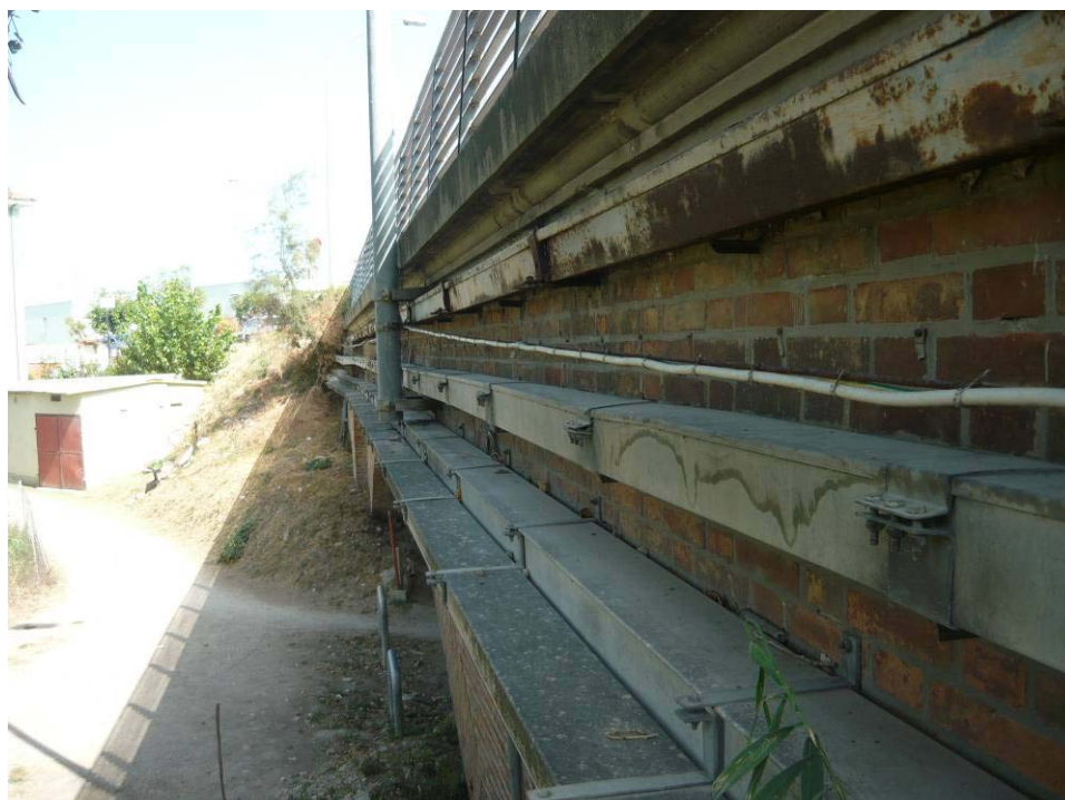
Figura 31 – Ponte SS16 – canali da rimuovere