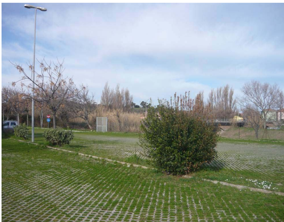
Figura 19 – Parcheggio ex CIF