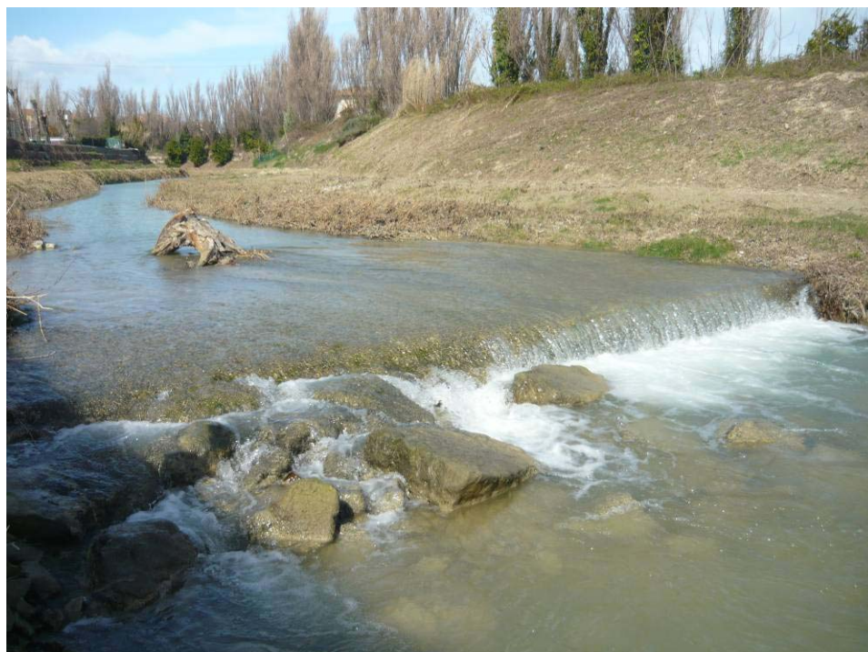
Figura 22 – Soglia