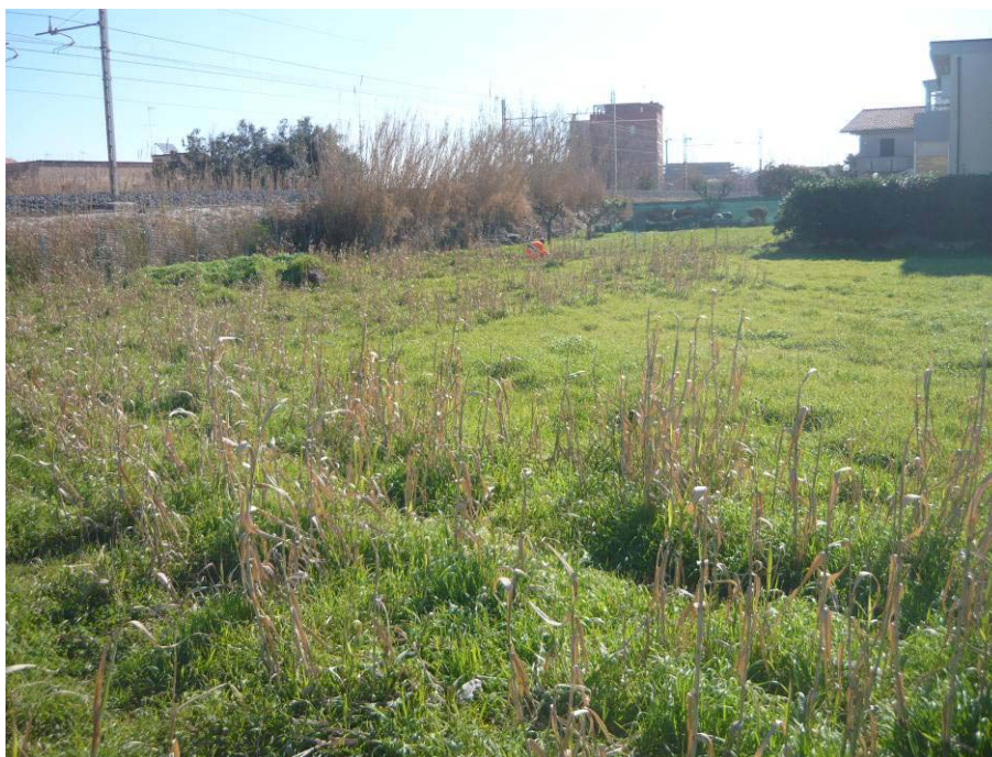
Figura 1 – Area sollevamenti via Anibal Caro