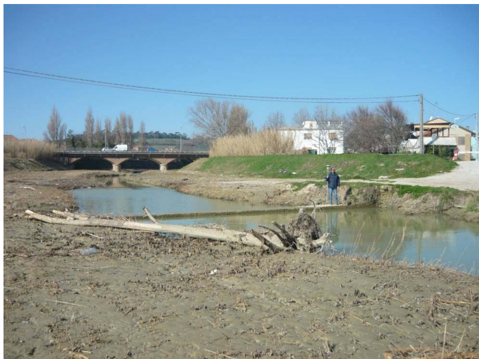
Figura 6 – Scatolare