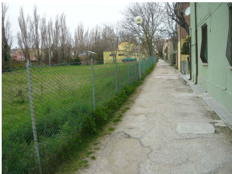
Figura 29 – Strada Area vasca