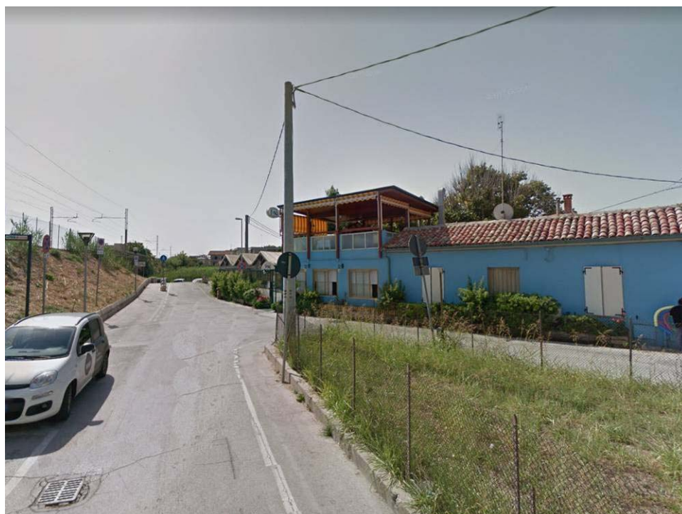
Figura 15 – Viale Romagna angolo via del Moletto