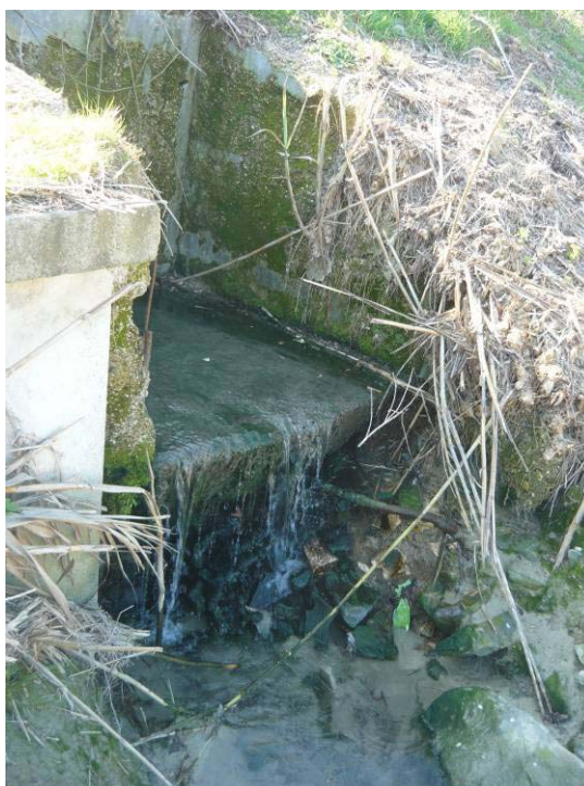
Figura 9 – Pozzetto P25