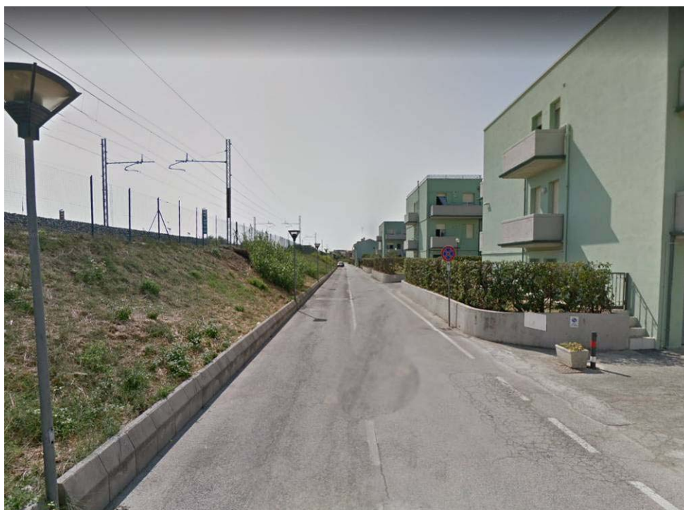
Figura 13 – Viale Romagna lato ferrovia