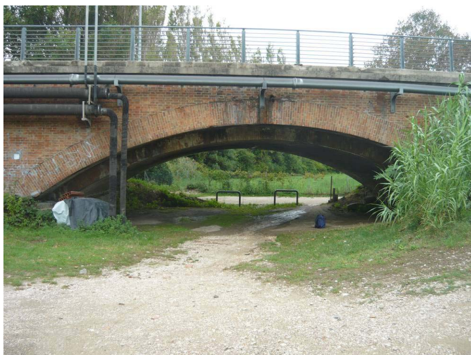
Figura 32 – Ponte SS16 – tubazioni gas