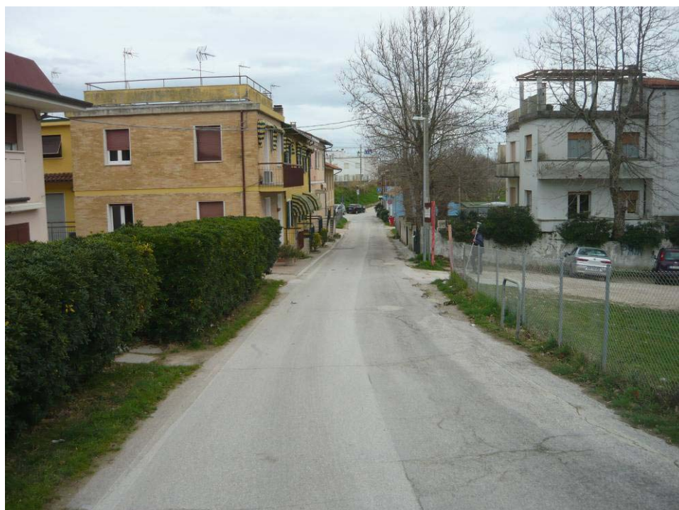
Figura 25 – Via del Moletto