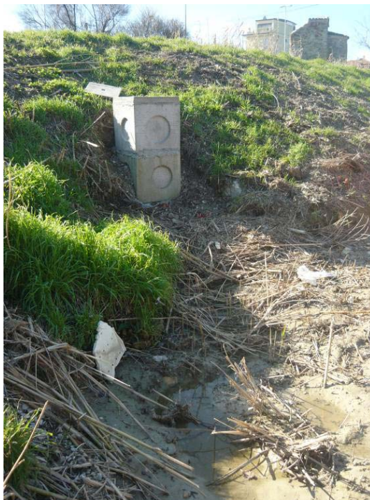
Figura 7 – Pozzetto P23 bis