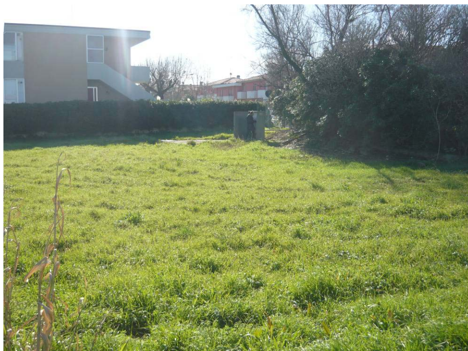
Figura 3 - Area sollevamenti via Anibal Caro