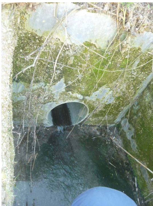
Figura 10 – Pozzetto P25