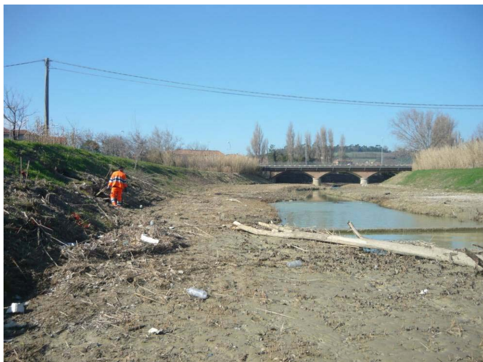
Figura 5 – Golena lato argine destro