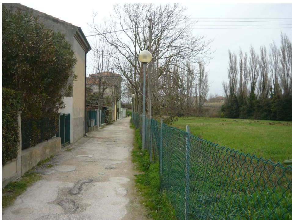
Figura 28 – Strada Area vasca