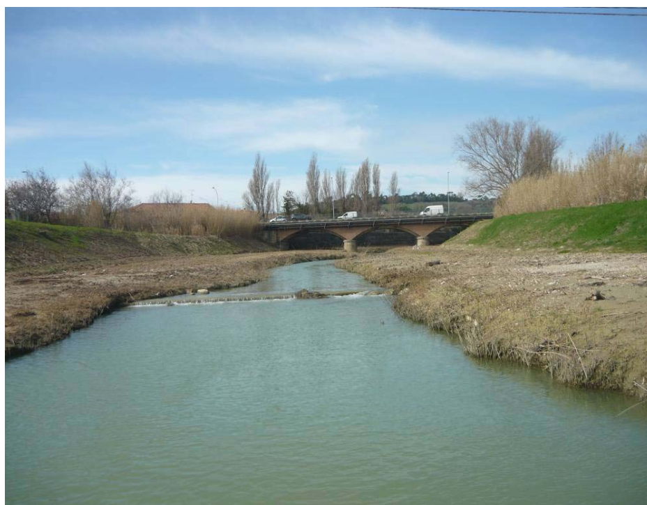
Figura 8 – Soglia