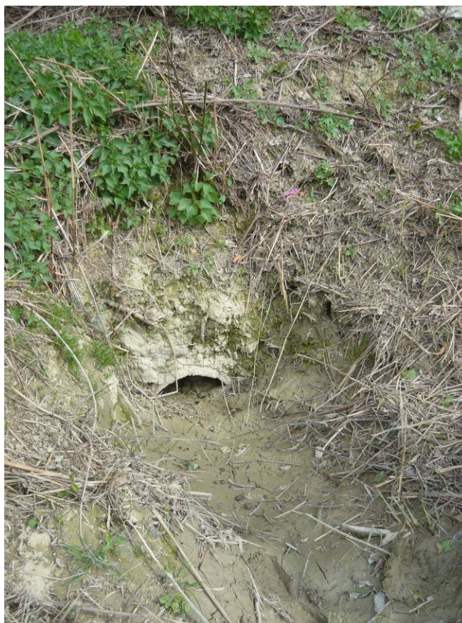
Figura 24 – Uscita P7