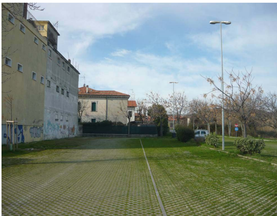
Figura 17 – Parcheggio ex CIF