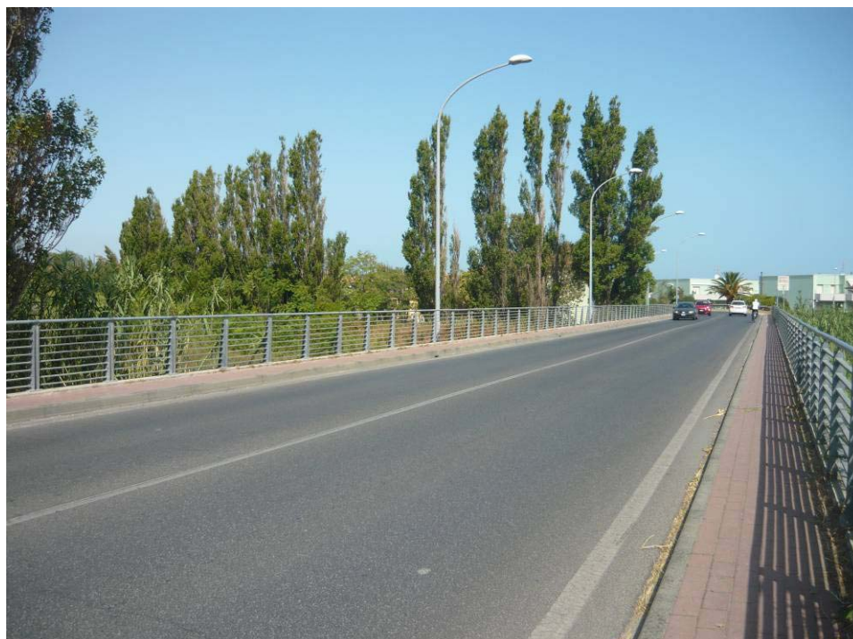
Figura 30 – Ponte SS16