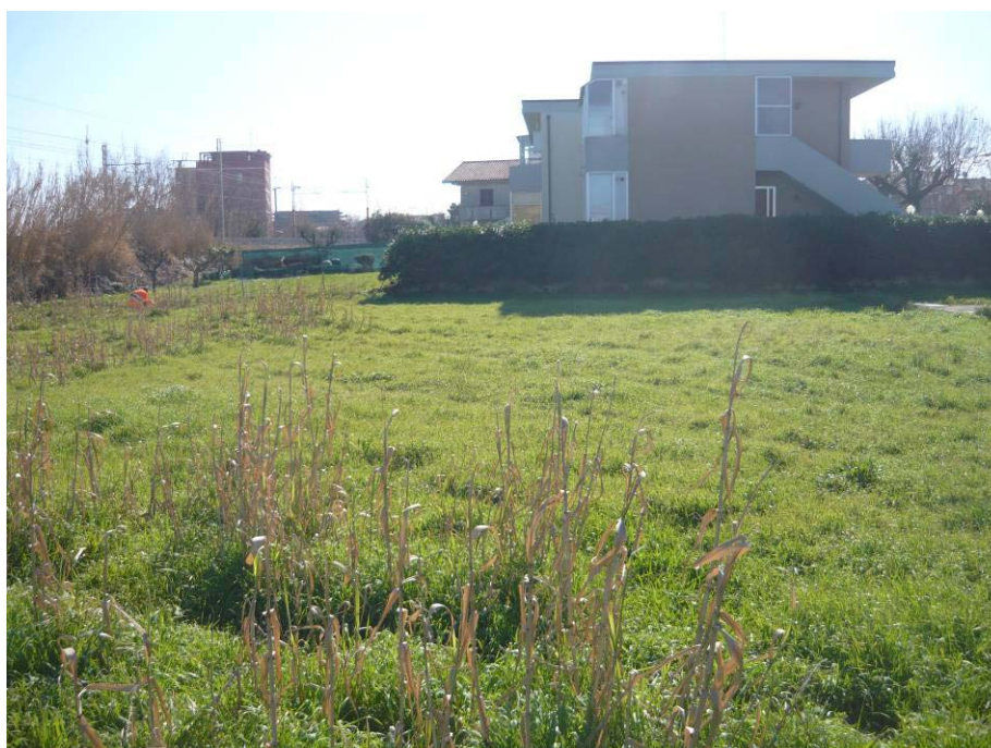
Figura 2 – Area sollevamenti via Anibal Caro