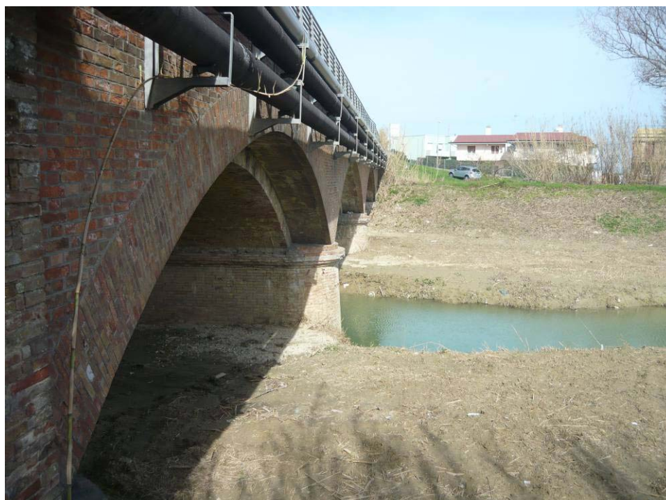
Figura 23 – Ponte SS16 lato foce