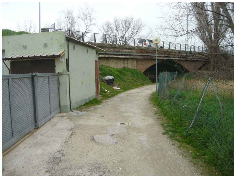
Figura 27 – Strada Area vasca