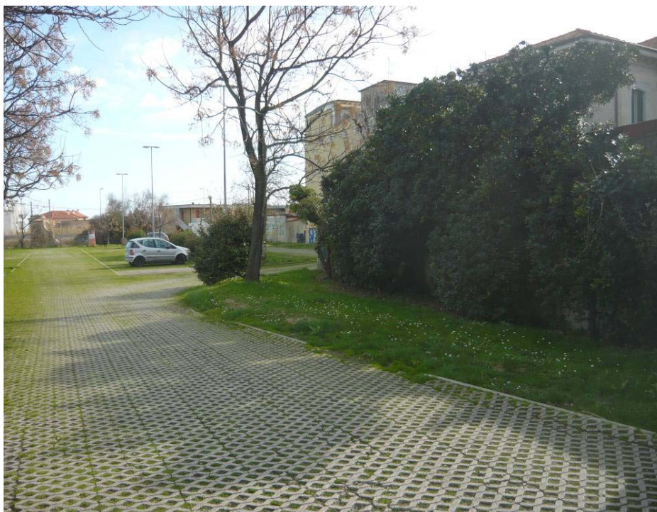
Figura 18 – Parcheggio ex CIF