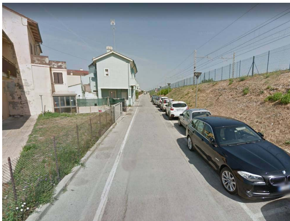
Figura 14 – Viale Romagna lato ferrovia